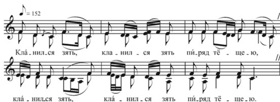
Рисунок 3. Свадебная песня. Новгородская область, Холмский район, д. Борисово.

Юго-западный ареал охватывает территорию междуречья Ловати и Шелони, бассейн Полы и северо-западное побережье озера Селигер. По мнению историков, в этой зоне происходило взаимодействие двух племенных групп – ильменских словен и псково-изборских кривичей. Фольклорные традиции этих мест в целом соотносятся с этим обстоятельством. По ряду показателей они могут быть названы переходными и обнаруживают близость к ловатским и локнянским традициям Псковщины. Это сходство отражается в присутствии напевов свадебных песен, скоординированных с текстами силлабической организации слогового состава 3+3+5, 5+4+5, 5+3 (Рисунок 3), что позволяет проследить западно-русские стилевые тяготения [17] .