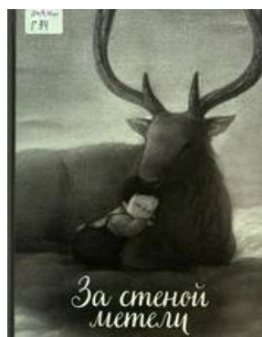
Рис.8. Обложка книги Гуоджин «За стеной метели» ("The Only Child")

которое легко переключается между мечтой и воспоминаниями, будто два этих мира сливаются в одно далекое место, куда должны отправиться сердце и сознание, чтобы понять, что такое быть одиноким, и почувствовать, каково это — быть любимым» [14] .