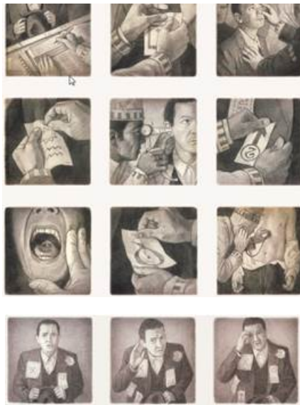
Рис. 4. Шон Тан. «Обработка» эмигранта в порту прибытия, графический роман «Прибытие»