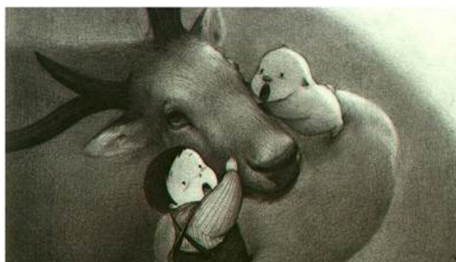
Рис.9. Иллюстрация из книги Гуоджин «За стеной метели»

Монохромная графика «За стеной метели» также подчинена стремлению усилить ретро-эффект в восприятии читателя: «... одна из причин сделать её чёрно-белой для меня заключалась вот в чём: представьте, как вы рассматриваете старые выцветшие фотографии, которые вызывают воспоминания об изображённых на них событиях. Прошлое будто бы проносится перед глазами. И чёрно-белая цветовая гамма действует похожим образом, она добавляет ностальгии. К тому же мне нравится грубоватая, зато универсальная техника карандашного рисунка» [12] (рис. 9, 10).