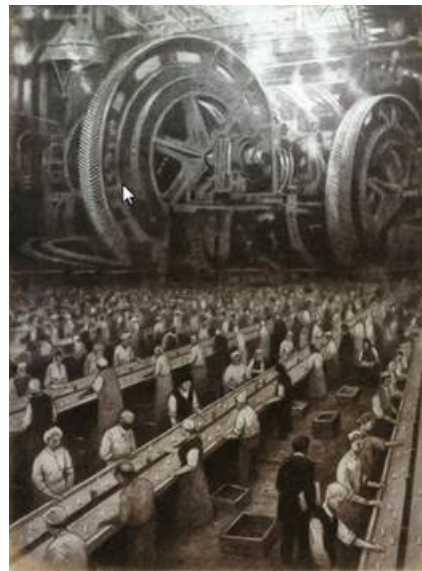
Рис. 5. Шон Тан. Изображение работы на конвейере, графический роман