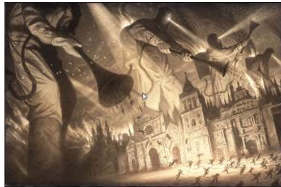
Рис. 3 а) б). Иллюстрации из графического романа Шона Тана «Прибытие»

Герой «Прибытия» даже имеет портретное сходство с Шоном, хотя азиатские черты внешности сознательно сглажены, потому что эта история раскрывает не только семейные, но общечеловеческие проблемы. Это бюрократические препоны, расовая и классовая дискриминация (рис. 4), «потогонная система» на рабочем месте (рис. 5), массовые репрессии и чистки.