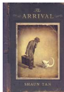
Рис. 2. Обложка романа Шона Тана «Прибытие»

Его наиболее известный графический роман – «Прибытие» (2007 г.), за который он