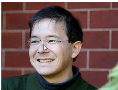
Рис. 1. Художник Шон Тан (род. 1974)

В 2011 году получил «Оскар» с анимационной лентой «Ничья вещь» (The Lost Thing), созданной им по мотивам собственной детской книги, а также стал лауреатом премии Астрид Линдгрен — самой престижной награды в области детской литературы.