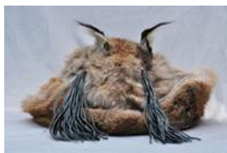
Фото 2. Мужская шапка из кожи косули из фондов Этнического музея Орочонов (пос. Сюньке, Китай)