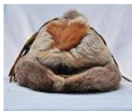
Фото 3. Мужская шапка из кожи косули из фондов Этнического музея Орочонов (пос. Сюньке, Китай)

Ранней осенью у косуль вырастают твердые рога, которые приобретают прямую форму. Из этой шкуры изготавливают мужские головные уборы. Эта разновидность головного убора орочонов стала самой известной и запоминающейся. Сейчас она сохранилась среди охотников, которые носят на голове рогатые шапки (фото 4-6) [7] .