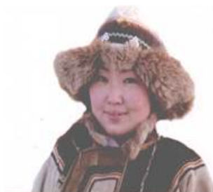
Фото 11. Женская кожаная шапка ороचना .