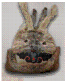
Фото. 7 Весенняя детская шапочка. Айгуньский исторический музей (г. Хэйхэ, Китай)