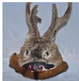
Фото. 9. Подростковая шапочка из фондов Этнического музея Орохонов (пос. Сюньке, Китай)

Выйдя из охотничьего костюмного комплекса, постепенно этот оригинальный вид головного убора получил широкую известность и вошел в моду, например, в качестве головного убора для детей ханьской национальности. В связи с этим, стали использоваться шкурки с голов других животных, например, кролика, а также имитации форм головы медвежат, котят, щенят, лисят и т.д.