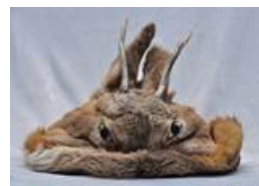
Фото. 6 Мужская шапка из кожи косули из фондов Этнического музея Орочонов (пос. Сюньке, Китай)

Молодежь и пожилые орочоны в основном носят этот вид шапок на фестивалях и в праздничные дни. Говорят, чем больше ветвистых рогов у шапки, тем крепче у орочона семейные узы [8] .