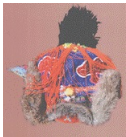
Фото 10. Женская праздничная кожаная шапка

об их этнических традициях, сформированных в результате многолетней жизненной практики и имеющий высокую художественную ценность. Сохранение традиции ношения этого головного убора и распространение его среди других народов, знакомых с этой культурой, свидетельствует о жизненности этой части традиционного костюма ороحوнов.