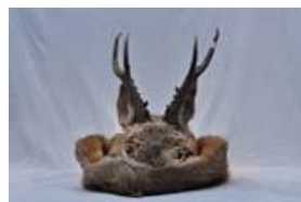
Фото. 5 Мужская шапка из кожи косули из фондов Этнического музея Орочонов (пос. Сюньке, Китай)