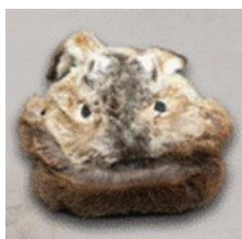
Фото 1. Мужская шапка из кожи косули. Айгуньский исторический музей (г. Хэйхэ, Китай)

рогов с парой ушей, очень теплые и легкие в носке. Эта шапка используется мужчинами, когда они не охотятся. На фото 1-3 приведены мужские шапки орочонов из кожи косули, входящие в коллекции Айгуньского исторического музея г. Хэйхэ и Этнического музея Орочонов в поселении Сюньке. Примеры мужских головных уборов без рогов приведены на фото 1-3.