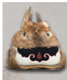
Фото. 8 Осенняя детская шапочка. Айгуньский исторический музей (г. Хэйхэ, Китай)