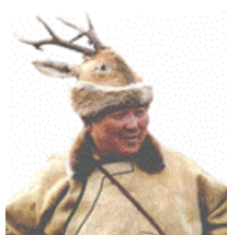
Фото. 4 Мужская шапка из кожи косули

Ранней осенью у косуль вырастают твердые рога, которые приобретают прямую форму. Из этой шкуры изготавливают мужские головные уборы. Эта разновидность головного убора орочонов стала самой известной и запоминающейся. Сейчас она сохранилась среди охотников, которые носят на голове рогатые шапки (фото 4-6) [7] .