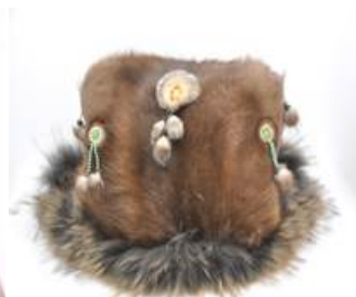
Фото 12. Женская праздничная кожаная шапка из фондов Этноического музея Ороحوнов (пос. Сюньке, Китай)