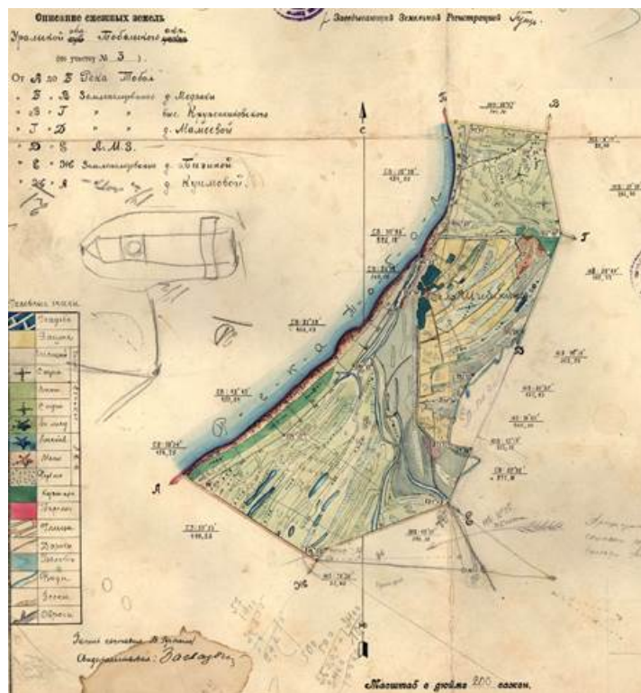
Рис. 2. План с. Шишкино с угодьями, составленный 28.04.1928 г. (Государственный архив в г. Тобольске (ГБУТО ГА в г. Тобольске). Ф. Р-551. Оп. 3. Д. 121).