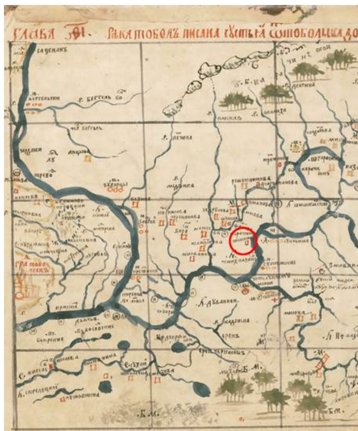
Рис. 1. Фрагмент карты С.У. Ремезова 1697 г. из Хорографической чертежной книги Сибири с указанием д. Шишкиной

Проведенные исследования с использованием комплексного подхода позволили не только более полно восстановить историю отдельного поселения, но и чуть глубже понять особенности освоения территории Сибири, социально-экономические процессы и повседневную жизнь русских в Зауралье в XVII – начале XX вв. Данная работа показала необходимость целенаправленного изучения сельских поселений Тобольского Прииртышья и в дальнейшем.