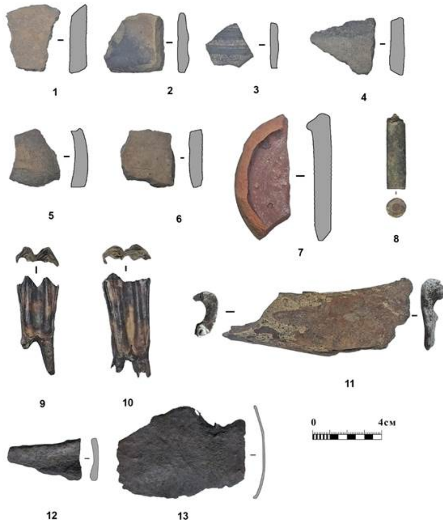
Рис. 5. Находки с шурфа 2. Горизонт 1 (1-7 – керамика (1-6 – неполированная, 7 – полированная); 8 – гильза винтовочная (латунь), 9-11 – кость, 12-13 – железо).