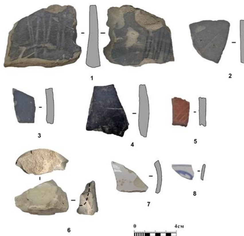
Рис. 4. Подъемный материал (1-5 – керамика (1-4 – неполированная, 5 – полированная), 6 – обломок помадной банки (фаянс), 7 – обломок фаянсовой посуды, 8 – фарфор).