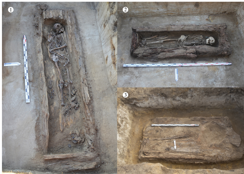
Рис. 3. Общий вид захоронений: 1 – погребение 4; 2 – погребение 5; 3 – погребение 7 (Мазары Бозеков).