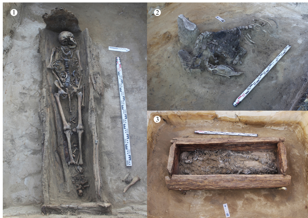
Рис. 2. Общий вид захоронений: 1 – погребение 1; 2 – погребение 2; 3 – погребение 3.

Погребение 3. Дальше по террасе, в 22 м к северо-востоку от захоронения лошади, было обнаружено мужское погребение. В могильной яме глубиной 120 см был найден гроб из массивных неочищенных лиственничных горбылей. На крышке гроба в изножье были зафиксированы богато орнаментированный берестяной сосуд с костями крупного скота и крупная бусина-одекуй. Внутри гроба покоились головой на северо-запад частично мумифицированные костные останки (рис 2: 3). Костяк покоился на спине с незначительным завалом на правую сторону корпуса, прижатый левым боком к северной стенке гроба; лицо обращено на юг. Левая рука была вытянута вдоль тела, правая согнута в локте; правая нога слегка согнута в колене, левая вытянута. Из украшений были обнаружены проволочные серьги в виде знака вопроса с белыми бусинами и металлическими пронизками. Костюм погребенного сохранился плохо, представлен остатками меховой шапки, кафтана, натазника, ноговиц и торбазов. У левой ноги была зафиксирована курительная трубка-хамса.