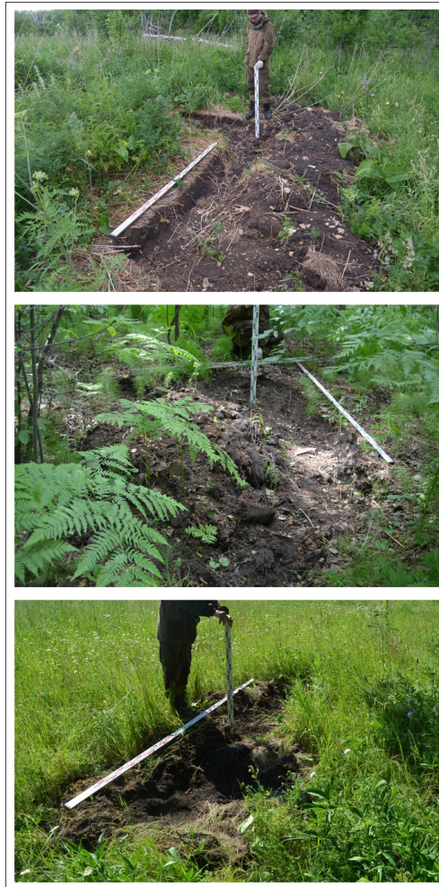
Рис. 1. Следы грабительских раскопок на объектах археологического наследия в Республике Башкортостан

Следы «копа» представлены небольшими т.н. «закопушками», соответствующими размерам ширины штыковой лопаты, ямами различных размеров аморфных форм, крупными траншеями и подобиями раскопов до 4-6 м в длину, а также «ямами-колодцами», обнаруживаемые в насыпях курганов. Во всех случаях, кроме «ям-колодцев» в курганах и отдельных «закопушек», вскрытая земля целиком не удаляется в отвал, а частично остается в пределах раскопанных ям.