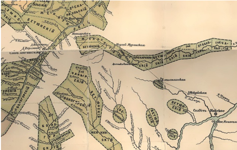
Рисунок 2. Бетюнские наслега Амгинского улуса по состоянию на 1896 г.

В 1917 г. в Амгинском улусе было три наслега бетюнского происхождения: Бетюнский (4 рода), Кеннянский (5 родов) и Уранайский (3 рода) (см.табл.2). Возможно, причиной бурного деления старых родов на ряд более мелких родов является принцип географической отдаленности от коренного рода и наличие черезполосицы с другими родами наслега и других наслегов. В 1912 г. Состоялось отделение Уранайского и Бадаранского родов в отдельный Уранайский наслег [6]. Кеннянский наслег примерно был образован в период 1913-1915 гг. [8].