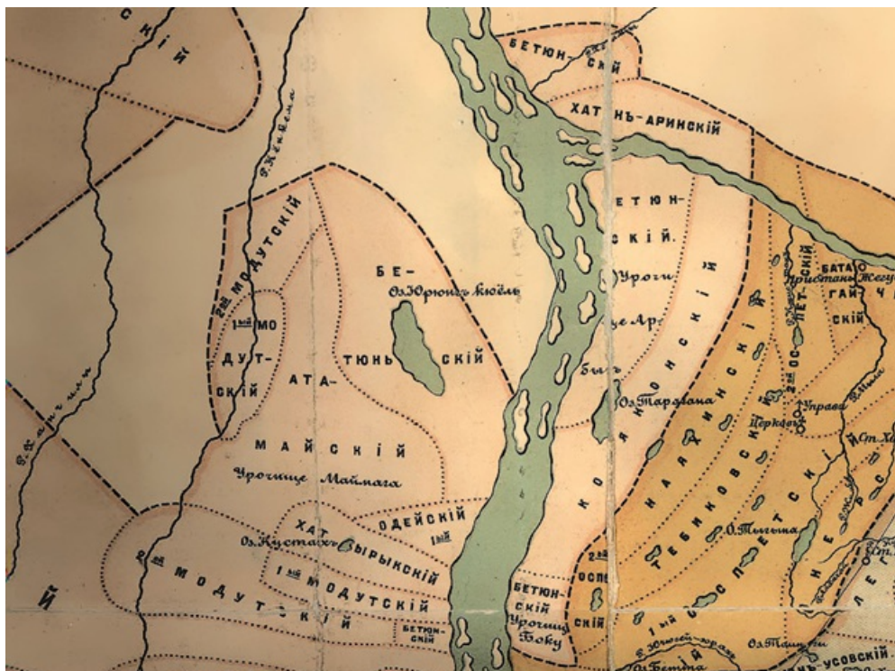
Рисунок 1. Бетюнские наслега Намского улуса по состоянию на 1896 г.

Исторически бетюнцы занимали северную часть территории Намского улуса, обитая на обоих берегах реки Лена и устья реки Алдан (см. рис. 1). В актах XVII века самостоятельная Бетюнская волость локализуется близ устья Алдана, по правую сторону реки, в районе озера Тарагана. В 1642 г. воевода направил посланника, чтобы убедить бетюнцев «жить на прежних своих местах на Тарагане» [19, с. 40]. По мнению Ф.Г. Сафронова, в 1720-е гг., с началом внедрения двухуровневой системы управления, Бетюнская волость вошла в состав вновь образованного Намского улуса [18, с. 13]. К сожалению, точной даты отделения Кобеконского наслега от коренного Бетюнского наслега на данный момент установить не удалось.