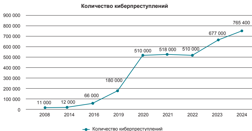
Рис. 1. График роста числа киберпреступлений с 2008 по 2024 г. 2

приятными. Ввиду значимости исследуемой категории необходимо провести изучение критериев и индикаторов обеспечения финансовой безопасности Российской Федерации, что будет способствовать своевременному выявлению проблем в этой сфере [4].