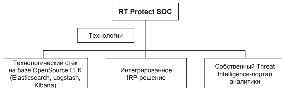
Рис. 2. Технологии SOC Ростех 5

Компания «РТ-информационная безопасность», которая входит в корпорацию «Ростех», представила на форуме «Цифровая индустрия промышленной России» (ЦИПР) отечественную систему RT Protect EDR для обнаружения кибератак и противодействия им. Кроме того, в настоящее время активно ведет работу центр SOC (отдел компании, который занимается постоянным отслеживанием состояния IT-инфраструктуры и защитой от киберугроз). В нем используются современные практики и технологии, которые представлены на рис. 2.