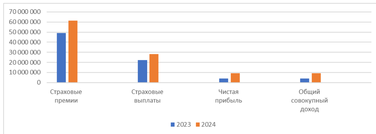
Рис. 1 Страховые и финансовые результаты за 2023-2024 гг., руб. [5]

компания показала значительный рост ключевых финансовых показателей. Объем страховых премий увеличился на 24,8%, что свидетельствует о расширении клиентской базы и росте страховой деятельности. Расходы на страховые выплаты выросли на 27,6%, однако компания смогла значительно повысить свою чистую прибыль на 141%, достигнув 9,38 миллиона рублей, что указывает на эффективное управление затратами и улучшение операционной эффективности (рис. 1).