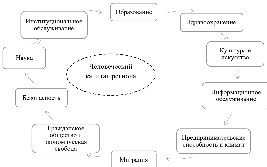
Рис. 2. Источники формирования человеческого капитала на региональном уровне [6-8]

Источниками формирования человеческого капитала на региональном уровне в широком определении являются следующие направления, представленные на рисунке 2.