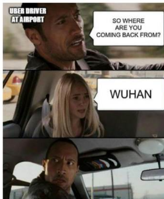
Рис. 1 – Мем «Ведьмина гора»

Автор исследования «Social Media Responses to the Pandemic: What Makes a Coronavirus Meme Creative» подмечает, что во время пандемии не появилось никаких новых образов или речевых конструкций, носящих юмористический характер, которые прижились бы, но можно заметить тенденцию к переработке старых шаблонов для мемов для новой реальности. На рисунке 1 изображен подобный шаблон мема, взятый из фильма «Ведьмина гора» 2009 года. То есть на момент начала пандемии данному мему было 10 лет.