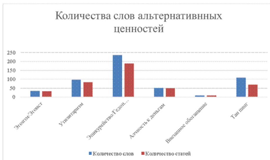
Fig.2. The number of words contradicting the core values on the website "People's Daily Online" during the period from 2020 to 2022.

В статьях «Народная газета онлайн», посвященных работе с кадрами КПК, часто используется термин «утилитаризм». В статье от 2020 года приводится анализ Генерального секретаря Си Цзиньпина о «формализме»: «Формализм по своей сути является субъективизмом, утилитаризмом, его корень - в ошибочном понимании оценки работы, отсутствии чувства ответственности, когда формальная работа подменяет собой реальные действия, а внешняя привлекательность скрывает противоречия и проблемы». («Народная газета» о мыслях и перспективах: Смотреть в долгосрочную перспективу, искоренять формализм. URL: http://opinion.people.com.cn/n1/2020/0722/c1003-31792377.html , дата обращения: 05.05.2024).