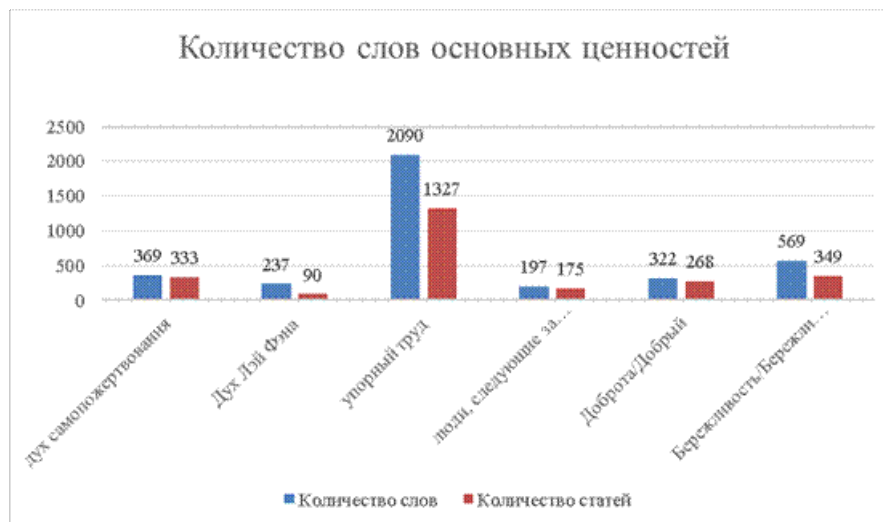
Fig.1. The number of words reflecting the core values on the website "People's Daily Online" during the period from 2020 to 2022.

Из рис.1 видно, что среди исследованных нами терминов, отражающих основные ценности, наиболее часто встречается «упорный труд» - 2090 раз в 1327 статьях. «Упорный труд» является важной составляющей выдающейся традиционной китайской культуры, а также одной из ключевых ценностей, подчеркиваемых Коммунистической партией Китая в наши дни. Например, в статье «Народная газета онлайн» от февраля 2021 года сообщалось о выступлении Си Цзиньпина на новогоднем чаепитии Всекитайского комитета Народного политического консультативного совета Китая, в котором он подчеркнул необходимость «развивать дух служения народу, как бык-тружеников, дух освоения новых земель, как бык-пионеры, и дух упорного труда, как старые вола». Статья далее поясняет: «Сила духа безгранична. Без духа нация не может встать на ноги, а государство - укрепиться. Только твердо стоя духовно можно противостоять историческим потокам, держать курс на гребне волны». (Активное продвижение духа быка-труженика, духа быка-пионера и духа старого вола. URL: http://world.people.com.cn/n1/2022/0627/c1002-32457406.html , дата обращения: 10.04.2024). Образы «быка-труженика», «быка-пионера» и «старого вола» хорошо известны, являясь глубокими культурными символами, они несут в себе духовный код китайского народа, его негибаемую волю к самосовершенствованию и упорному движению вперед.