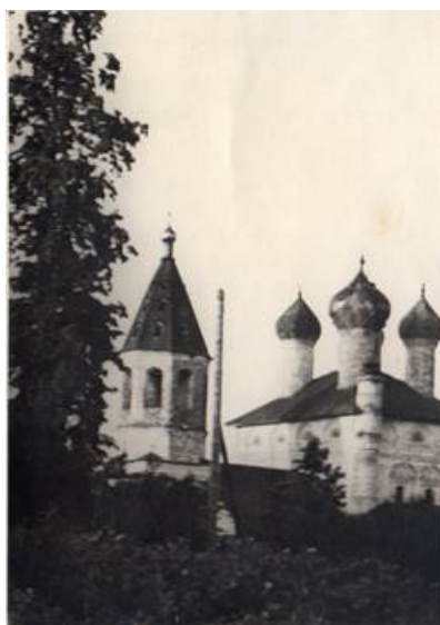
Изображение 1. Церковь Николая Чудотворца (Никольская церковь) в селе Батюшково Московской области (1952).

Батюшково, Дмитров, Дмитровский уезд, краеведение, история, Церковь Николая Чудотворца, памятник архитектуры, храм, культурное наследие, церковное имущество