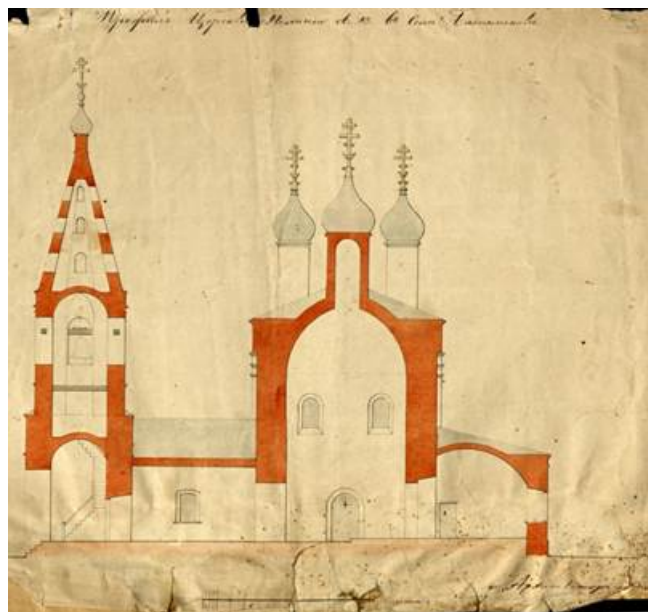
Изображение 3. МБУ "Музей-заповедник «Дмитровский кремль»". МЗДК КП ОФ 11863 Архитектор Дрегалов Василий. Чертёж разреза южного фасада по линии А. – В. (запад-восток) храма св. Николая Чудотворца в с. Батюшково. 1853.