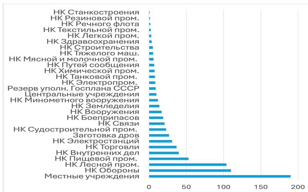
Рис. 1. Май 1943 г.

В качестве иного подхода может быть использовано объединение статистики по группе потребителей. Для примера приведем данные по распределению бензина (смеси) за май 1943 г. в тоннах. Из общего количества потребителей для сокращения количества строк в диаграмме исключим наркоматы юстиции, стройматериалов, бумажной промышленности, финансов, морского и военно-морского флота, заготовок, среднего машиностроения, рыбной промышленности, авиапромышленности, черной металлургии, а также кинокомитет и центральный совет Осоавиахима, которые потребляли менее 1 тонны бензина в месяц.