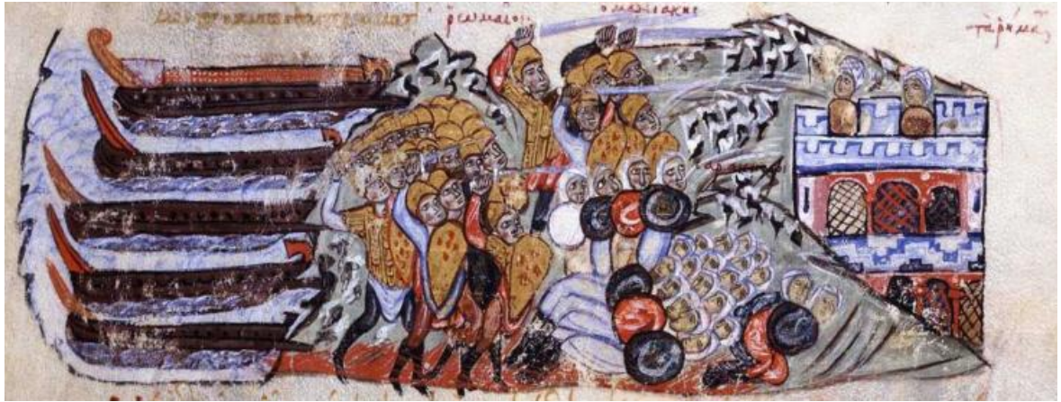
Рис. 14. Высадка войск Георгия Маниака на Сицилию в 1038 году

(Ioannes Scylitzes, Manuscripto, H. 212)