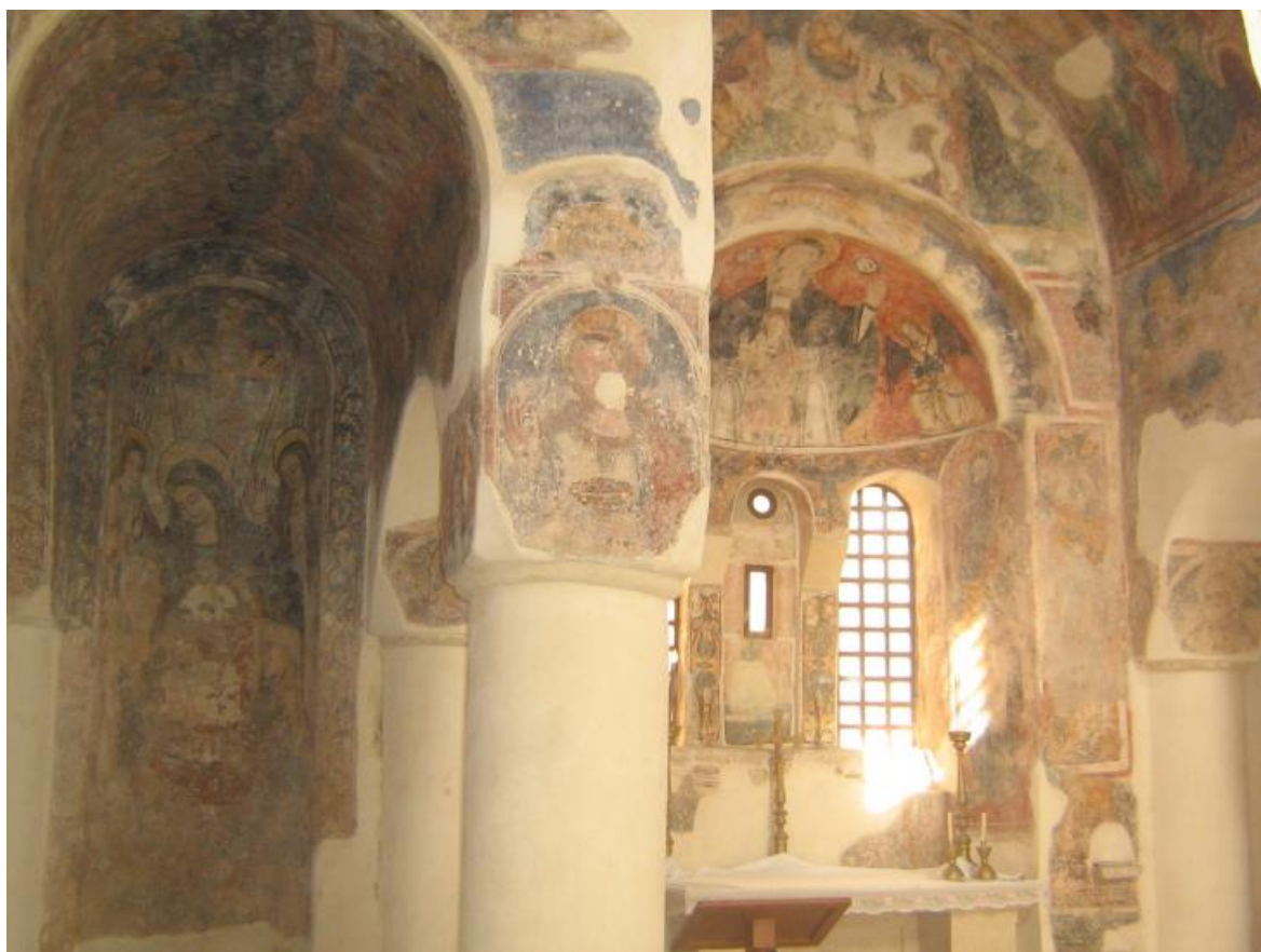
Рис. 4. Храм св. Петра в Отранто. Интерьер. IX–X вв. URL: https://www.bisanzioit.blogspot.com/2015/09/la-chiesa-di-san-pietro-otrant.html (Дата обращения: 12.09.2023)

Fig. 3. The Church of St. Petra in Otranto. Exterior. IX–X centuries URL: https://www.bisanzioit.blogspot.com/2015/09/la-chiesa-di-san-pietro-otrant.html (date of application 12.09.2023)