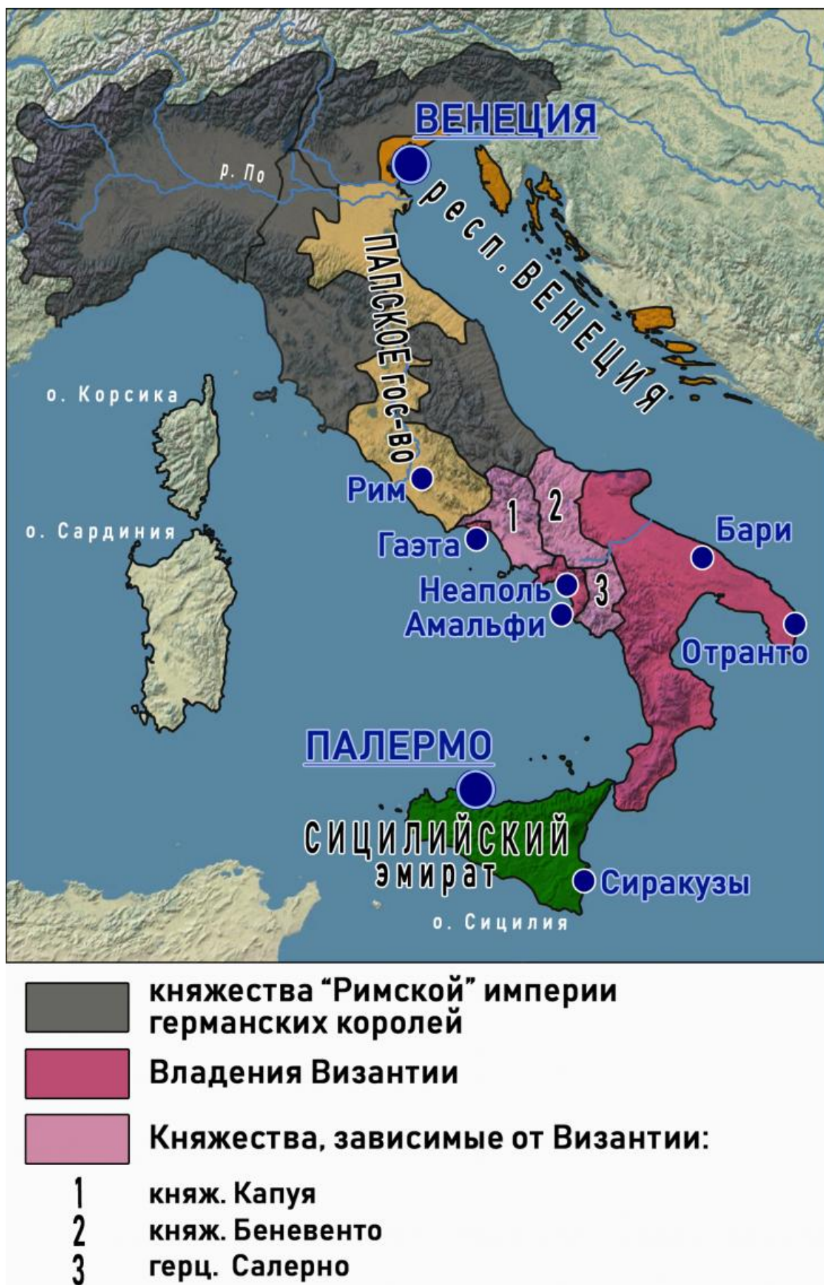
Рис. 17. Политическая обстановка в Италии на рубеже X – XI веков