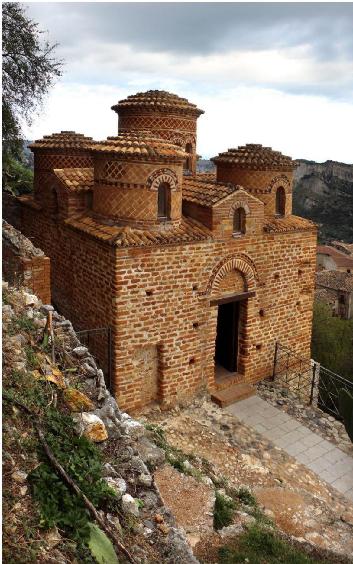
Рис. 8. Византийский храм IX в. Католлика ди Сило в Калабрии. Экстерьер.

URL: https://www.calabriatours.org/heritage/cattolica-di-stilo.html (Дата обращения: