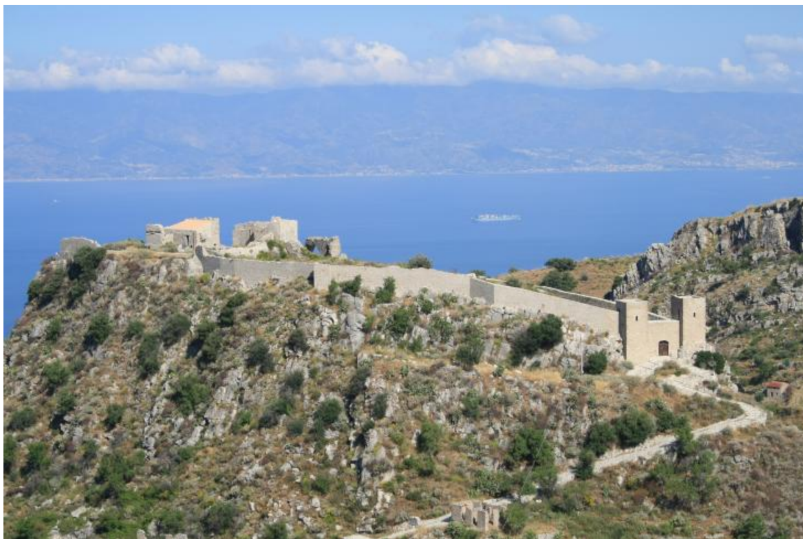
Рис. 1. Византийский кастрон Сан Никето. XI век.