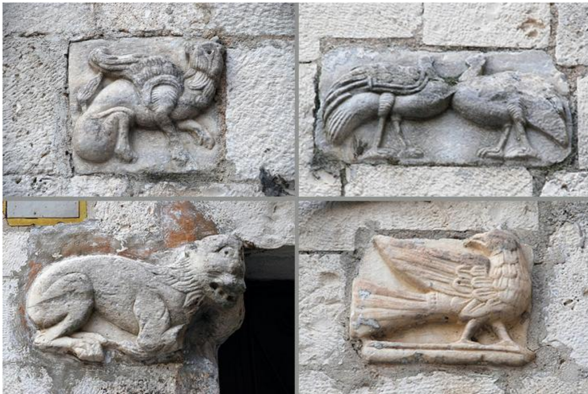
Рис. 7. Византийские барельефы XI–XII вв. в кладке стены храма св. Анны в Бари.

URL: https://www.barinedita.it/bari-report-notizie/n3228-bari-la-piccola-chiesa-di-sant-anna--li-dove-si-celebra-la-benedizione-dei-neonati (Дата обращения: 12.09.2023)