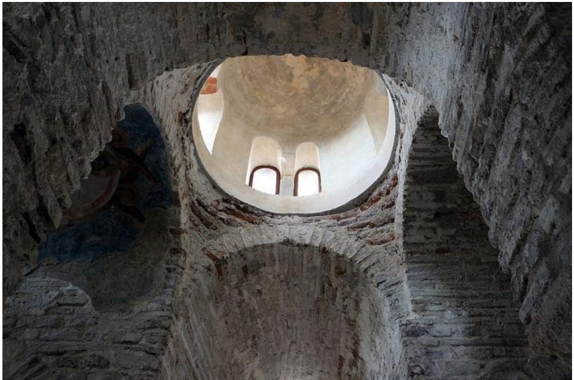
Рис. 9. Византийский храм IX в. Католика ди Стило в Калабрии. Интерьер.

URL: https://www.calabriatours.org/heritage/cattolica-di-stilo.html (date of application 12.09.2023)