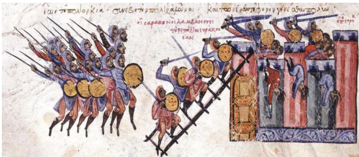
Рис. 10. Захват арабами Сиракуз в 878 году

(Ioannes Scylitzes. Synopsis historiarum // Manuscrito del siglo XII / Biblioteca Nacional de España. H. 101)