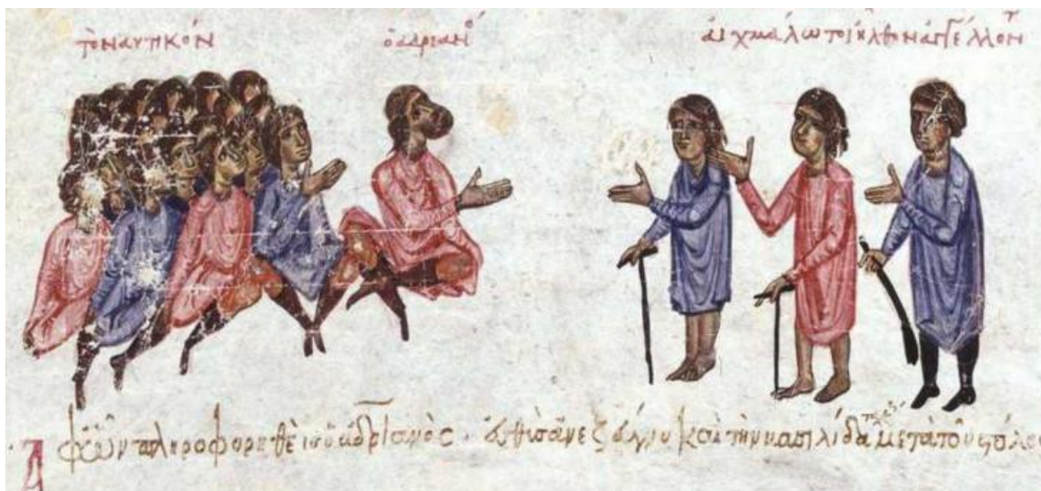
Рис. 12. Беженцы из Сиракуз подтверждают падение города