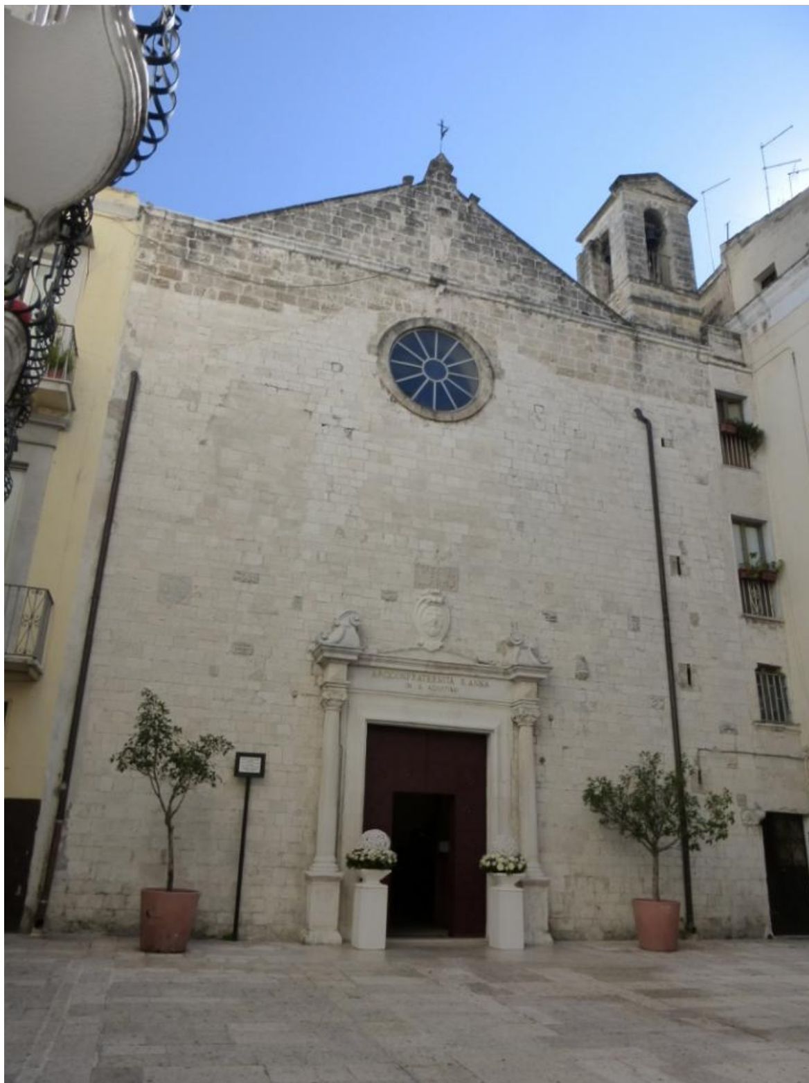
Рис. 6. Стена храма св. Анны XVI в. в Бари с византийскими барельефами XI–XII вв. в кладке стены. URL: https://www.barinedita.it/bari-report-notizie/n3228-bari-la-piccola-chiesa-di-sant-anna--li-dove-si-celebra-la-benedizione-dei-neonati (Дата обращения: 12.09.2023)

Fig. 6. The wall of the Church of St. Annas of the XVI century in Bari with Byzantine bas-reliefs of the XI-XII centuries in the masonry of the wall. URL: https://www.barinedita.it/bari-report-notizie/n3228-bari-la-piccola-chiesa-di-sant-anna--li-dove-si-celebra-la-benedizione-dei-neonati (date of application 12.09.2023)