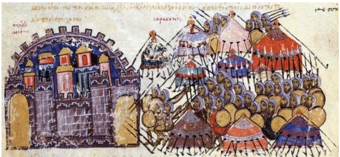
Рис. 15. Оборона Мессины от арабов под руководством Катакалона Кекавмена в 1040 году

(Ioannes Scylitzes, Manuscripto, H. 212)