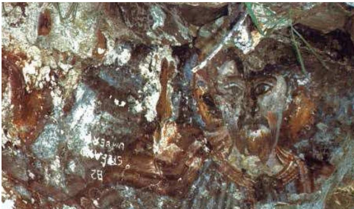
Рис. 2. Фреска с изображением Христа Пантократора в храме Санта Мария Аннунзиата. XI век.

https://it.wikipedia.org/wiki/Castello_di_Santo_Niceto#/media/File:Castello_San_Niceto.JPG (date of application 12.09.2023)