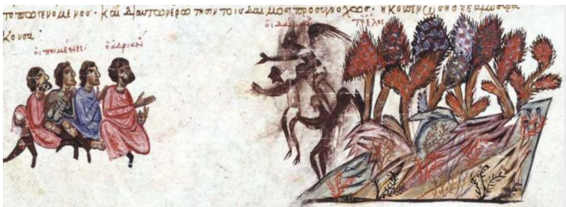
Рис. 11. Флотоводцу Адриану сообщают о падении Сиракуз под натиском демонов

(Ioannes Scylitzes. Synopsis historiarum // Manuscrito del siglo XII / Biblioteca Nacional de España. H. 101)