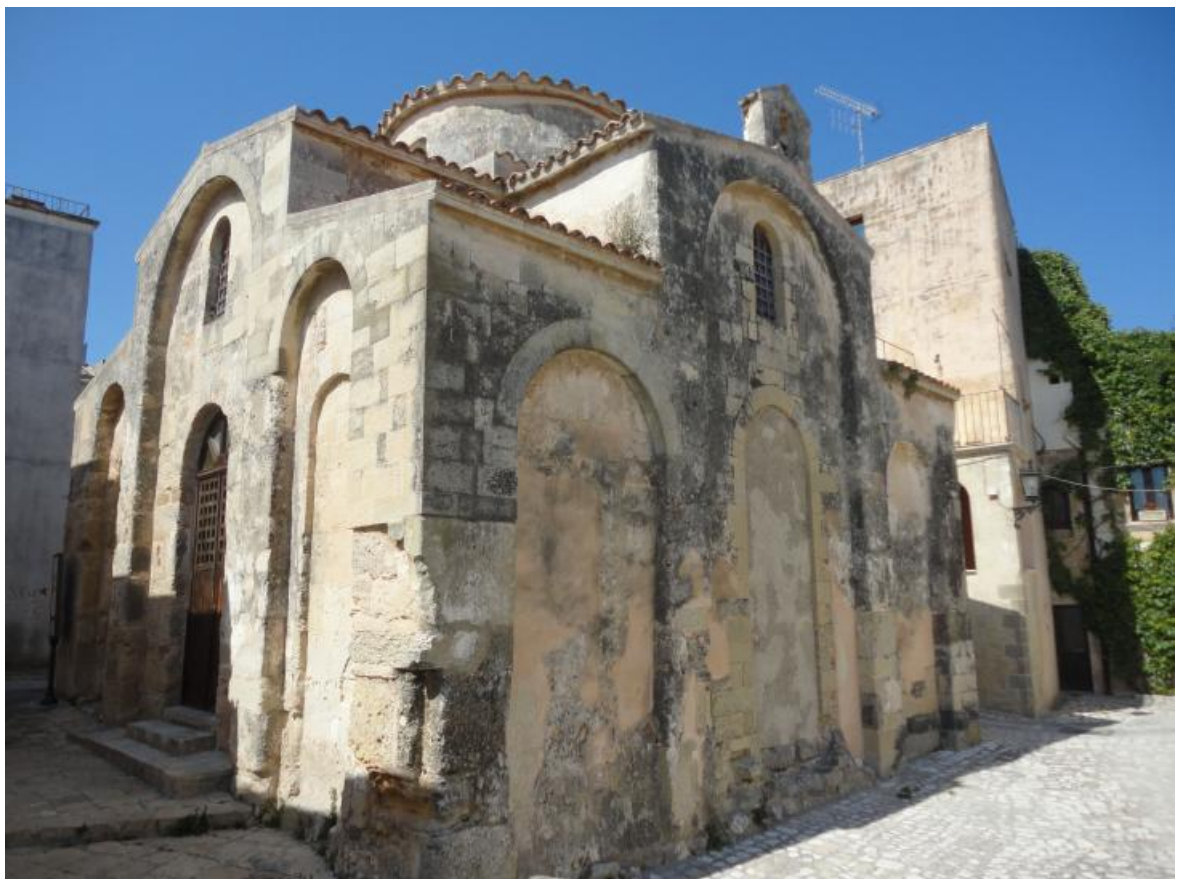
Рис. 3. Храм св. Петра в Отранто. Экстерьер. IX–X вв. URL:

Наиболее яркие памятники византийской церковной архитектуры и прикладного искусства в Южной Италии следующие. Крестовокупольный Храм св. Петра в Отранто, построенный в IX–X вв. (рис. 3, 4) [23] . Византийская напольная мозаика VI–VII вв., сохранившаяся в подвале кафедрального собора св. Сабина XIII в. в Бари, построенного на месте разрушенного нормандцами в 1156 году ромейского собора (рис. 5) [24] . В кладку собора св. Анны XVI века в Бари включены барельефы предшествующей византийской церкви св. Пелагии XI в. (рис. 6, 7) [25] . Самым представительным архитектурным памятником изучаемой нами эпохи является расположенный в городке Стило в калабрийской провинции Реджо пятикупольный византийский храм IX в. Католика ди Стило (рис. 8) [26] . Интерьер храма, к сожалению, полностью утрачен (рис. 9). Партикулярных зданий и государственных резиденций византийского периода в Южной Италии не сохранилось. Археологические артефакты (в основном элементы отделки храмов) византийского периода хранятся в Музее св. Николая в Бари [27, p. 7-87] .