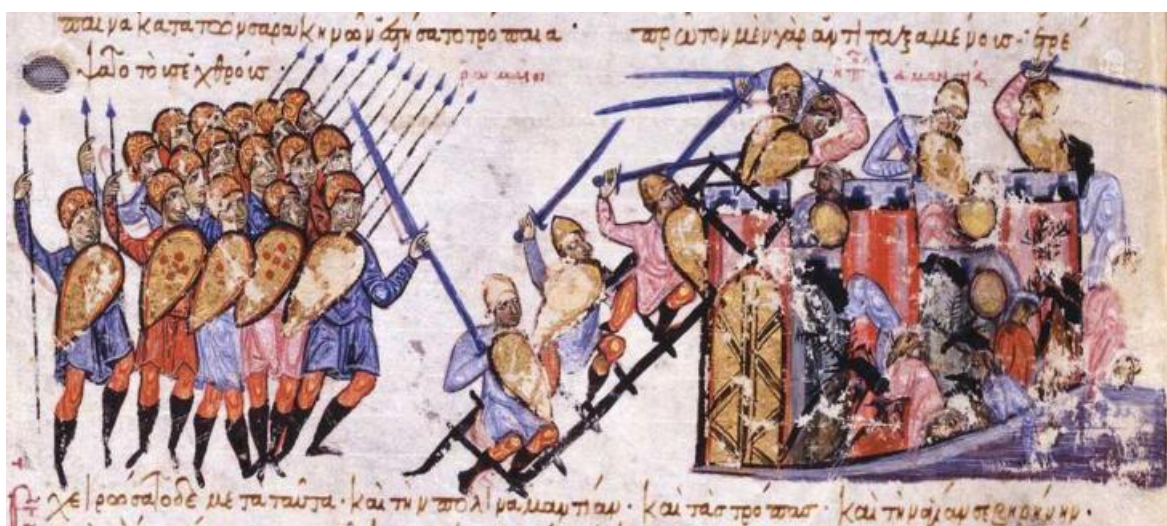
Рис. 13. Взятие Амантеи Никифором Фокой Старшим в 889 году