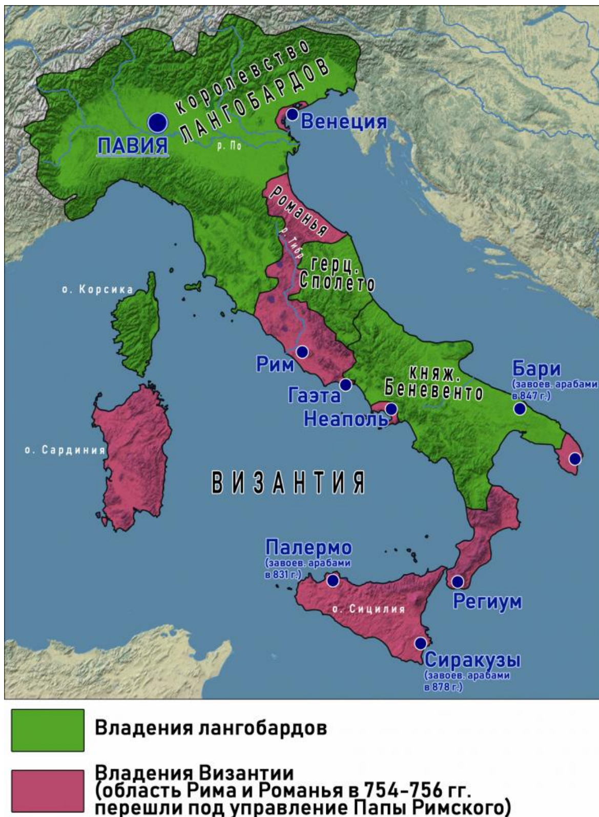
Рис. 16. Политическая обстановка в Италии в середине VIII – начале IX веков

века из бывших византийских областей Романья и Пентаполис были образованы владения Папы Римского (см. рис. 16) [35, р. 1577, 1624-1625] .