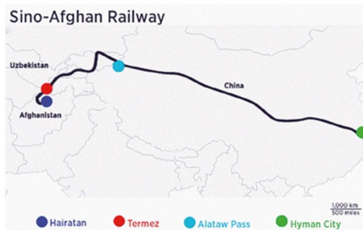
Рис. 2. Китайско-афганская железная дорога [18].