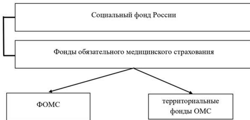
Рисунок 1 – Государственные внебюджетные фонды в Российской Федерации

Примечание. ФОМС – федеральный фонд обязательного медицинского страхования, ОМС – обязательное медицинское страхование.