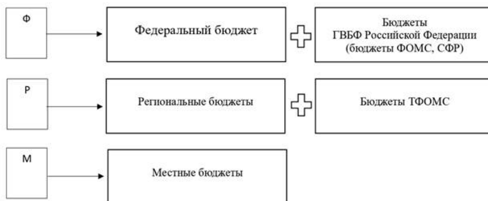
Рисунок 2 – Место государственных внебюджетных фондов в бюджетной системе Российской Федерации

На рисунке 2 наглядно представлено место государственных внебюджетных фондов в бюджетной системе Российской Федерации. Так, в частности, мы наглядно видим, что на федеральном уровне два бюджета государственных внебюджетных фондов Российской Федерации (бюджет Федерального фонда обязательного медицинского страхования, бюджет Социального фонда России), на территориальном – 90 бюджетов территориальных фондов обязательного медицинского страхования (созданы в каждом субъекте Российской Федерации, а также в г. Байконур).