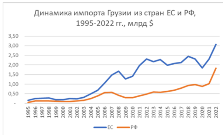
Рисунок 4 - Динамика импорта Грузии из стран ЕС и РФ, 1995-2022 гг.

В 2022 г. вино было лидером экспорта Грузии на российский рынок с 161 млн долл. США, а ферросплавы были вторыми по величине с 109 млн долл. США, за ними следовал экспорт безалкогольных напитков — 90 млн долл. США и легковых автомобилей — 76 млн долл. США.