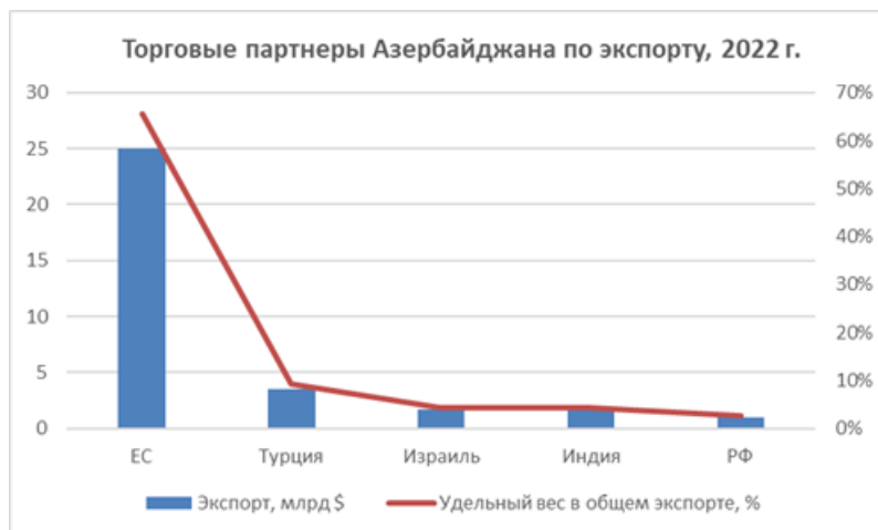
Рисунок 2 - Торговые партнеры Азербайджана по экспорту, 2022 г.