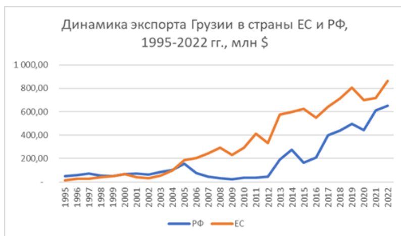
Рисунок 3 - Динамика экспорта Грузии в страны ЕС и РФ, 1995-2022 гг.

Как показано на рисунках 1 и 2, Европейский союз является первым торговым партнером Азербайджана по экспорту и вторым по импорту по состоянию на 2022 г. Удельный вес ЕС в общем экспорте Азербайджана составляет более 65%, при этом удельный вес в импорте – около 16%. Важно обозначить, что в 2020 г. ЕС занимал также первое место по экспорту продукции в Азербайджан, однако, исходя из рисунка 1, в 2022 г. уступил свое место РФ, что можно связать, в частности, с выходом из ЕС в конце 2020 г. Великобритании и активизацией торговых отношений Азербайджана с РФ.