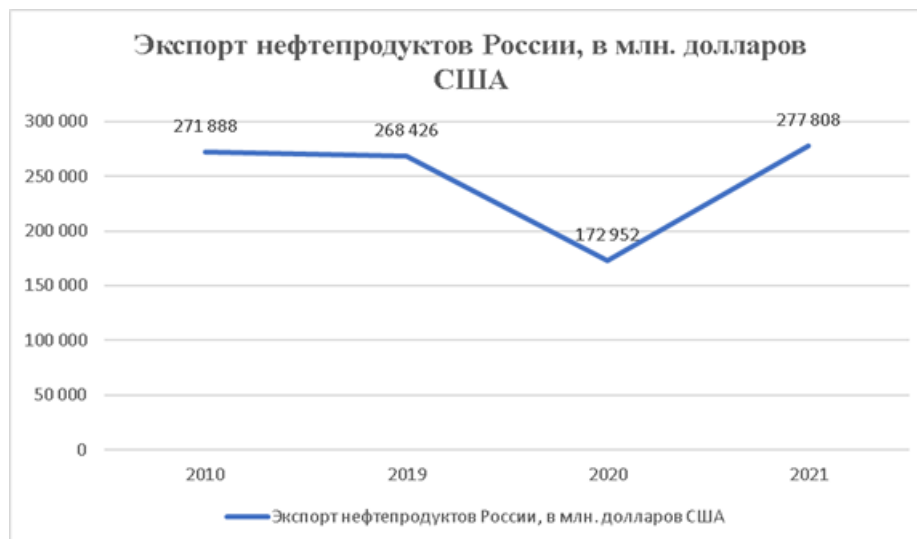
Диаграмма 2. Экспорт нефтепродуктов России, в млн. долларов США [21]

Анализ динамики экспорта нефтепродуктов России в период 2010-2021 годов демонстрирует неравномерное развитие данного сектора внешней торговли, что существенно влияет на экономическую безопасность страны. В 2010 году объем экспорта составлял 271 888 млн долларов США, к 2019 году показатель незначительно снизился до 268 426 млн долларов США, что свидетельствует о относительной стабильности экспортных поставок в этот период. Однако в 2020 году произошло резкое падение экспорта до 172 952 млн долларов США, что было обусловлено влиянием пандемии COVID-19 и общим снижением мирового спроса на энергоресурсы. В 2021 году наблюдалось восстановление и рост показателя до 277 808 млн долларов США, что даже превысило докризисный уровень 2010 года.