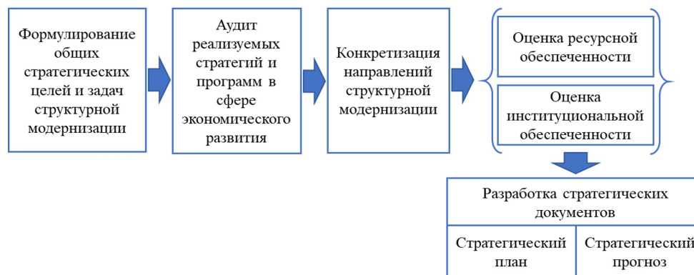
Рисунок 2 – Этапы разработки стратегии структурной модернизации экономики России