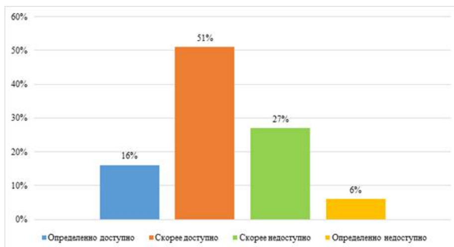
Рис. 2. Распределение ответов респондентов на вопрос «Как бы Вы оценили доступность высшего образования в Барнауле?», %.

образование скорее недоступно: «Несмотря на достаточно существенное количество бюджетных мест, всем их не хватает, многие вынуждены либо учиться платно, либо пойти в колледж. Платное же образование в настоящее время слишком дорогое и не каждая семья сможет себе его позволить», «В платном варианте медицинское образование вовсе является чем-то мало доступным. Стоимость образовательных программ в год начинается от двухсот тысяч рублей, что мало считается доступным для индивида». При этом 6% опрошенных респондентов отмечают, что высшее образование в городе Барнауле определено недоступно: «Знаю много примеров, когда люди не смогли поступить на бюджет, а коммерческую основу обучения они не потянули. В итоге получилась ситуация, когда человек рад бы учиться по программам высшего образования, но просто из-за недостатка денежных средств не смог себе этого позволить».