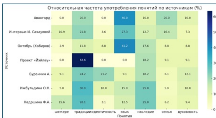
Рис. 2 – Тепловая карта распределения понятий по источникам

Сравнительный анализ источников выявил различия в акцентах. В научных статьях преобладают упоминания «идентичности» и «духовности». В медиапубликациях и официальных выступлениях доминируют «язык» и «традиции». В проектных документах больше внимания уделяется культурно-бытовым аспектам, связанным с национальной кухней и семейными традициями, что наглядно отражено на рис. 2.