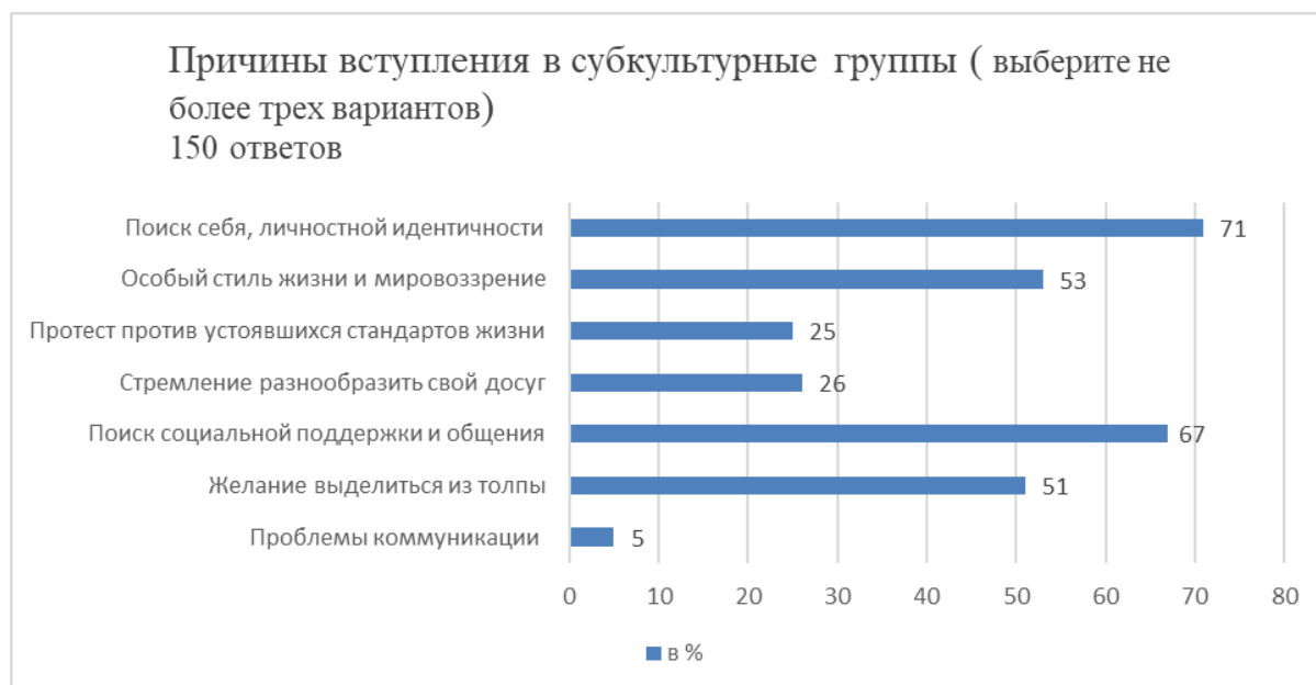
Рисунок 2. Распределение ответов на вопрос «Причины вступление в субкультурные группы?» (в % от всех полученных ответов)

интересно узнать новое», «увлечение и интерес с детства (язычеством, футболом, аниме, музыкой)».