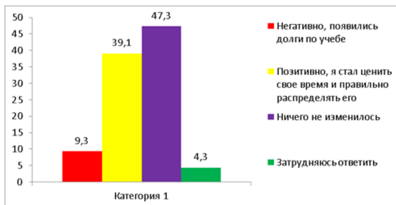
Рис. 1 Распределение ответов респондентов на вопрос «Как трудовая деятельность повлияла на Вашу успеваемость в университете?» (в% к числу ответивших)

Негативное влияние вторичной занятости на успеваемость отметили 9,3% респондентов, у которых возникли академические задолженности, что может говорить о высокой рабочей нагрузке и нехватке временных ресурсов для успешного обучения. Около 40% респондентов указали на позитивное влияние вторичной занятости, отмечая личностный рост и улучшение навыков управления временем. 47,3% респондентов не зафиксировали изменений в своей успеваемости в результате вовлечения во вторичную занятость.