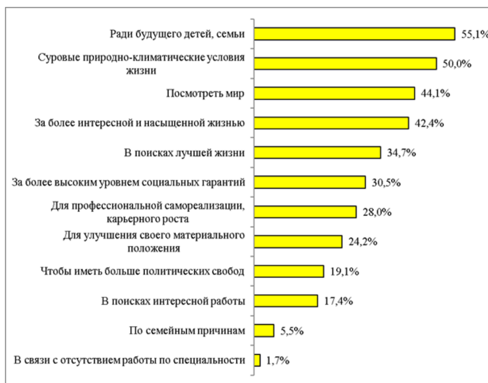
Рисунок 2. Причины, по которым молодежь уехала бы на постоянное место жительства в другую страну/другой регион

Миграция из региона обусловлена комплексом факторов и причин, одни из которых выталкивают из региона, а другие притягивают в другие регионы [13, 14, 15]. Это семейные, климатические, географические, культурные, социальные, экономические и политические причины. В опросе лидирующей причиной возможного переезда из Якутии большинство респондентов назвали стремление обеспечить лучшее будущее для своих детей и семьи (55,1%), это подчеркивает важность семейных ценностей для молодежи (рисунок 2). Вторым по значимости фактором эмиграции, который являлся выталкивающим, выступают суровые природно-климатические условия проживания в Якутии, которые заставляют задуматься о переезде в климатически более благоприятный регион. Желание путешествовать и вести насыщенную жизнь также оказывает существенное влияние на молодежь при принятии ими решения о миграции. В дополнение, экономические мотивы, связанные с поиском более высокого уровня жизни, материального благополучия, играют не последнюю роль в принятии решения об эмиграции.