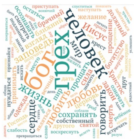
Рис.1 Облако слов по материалам проповедей российских католических священников

Далее методом количественного контент-анализа были подсчитаны и систематизированы случаи употребления лексемы «грех» и её производных. Также был произведен анализ всего отобранного массива текстовых данных на предмет частотности употребления имеющихся лексем. Результаты подсчета были визуализированы путем создания облака слов, представленного на Рис.1. Для сравнения аналогичный метод был применен для анализа текста статьи «Грех» Катехизиса Католической церкви (Рис. 2).