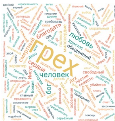
Рис. 2 Облако слов по материалам гл.2 ст.8 Катехизиса Католической церкви