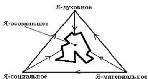
Рис. 1 Соотношение структур «Я».

По нашему мнению, достаточно полно и ясно, в процессуальном плане, структура личности рассматривается доктором психологических наук, профессором В.В. Козловым. Предложенная им 3х компонентная модель («Я-материальное», «Я-социальное», «Я-духовное») личности [5, с. 88] с нашим дополнением («Я-осознающее») в качестве интегральной составляющей указанных 3х частей имеет следующий вид (см. рис.1.).