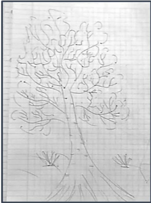
Рисунок 3 – Дерево с отсутствующей линией кроны (составлено автором)

Около 35% студентов вообще не очертили крону линией (рисунок 3). На их рисунках дерево изображено с разветвленными ветвями, в некоторых случаях с листьями.