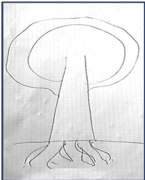
Рисунок 1 – Рисунок сирийского студента с двойной линией кроны (составлено автором)

права). Сам студент, услышав трактовку рисунка, удивленно согласился с таким выводом.