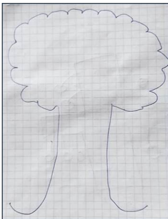
Рисунок 2 – Линия кроны дерева с остановками (составлено автором)

Студент подтвердил, что он одинаково серьезно относится к соблюдению и российских, и сирийских норм (правовых и социокультурных).