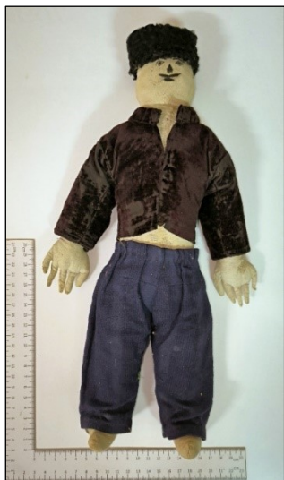
Рис. 2. Кукла «крымский татарин».