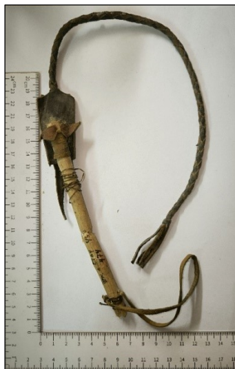
Рис. 3. Плётка детская.

№14168/1153. From the Bakhchisaray Historical-Cultural and Archeological Museum-Preserve collection