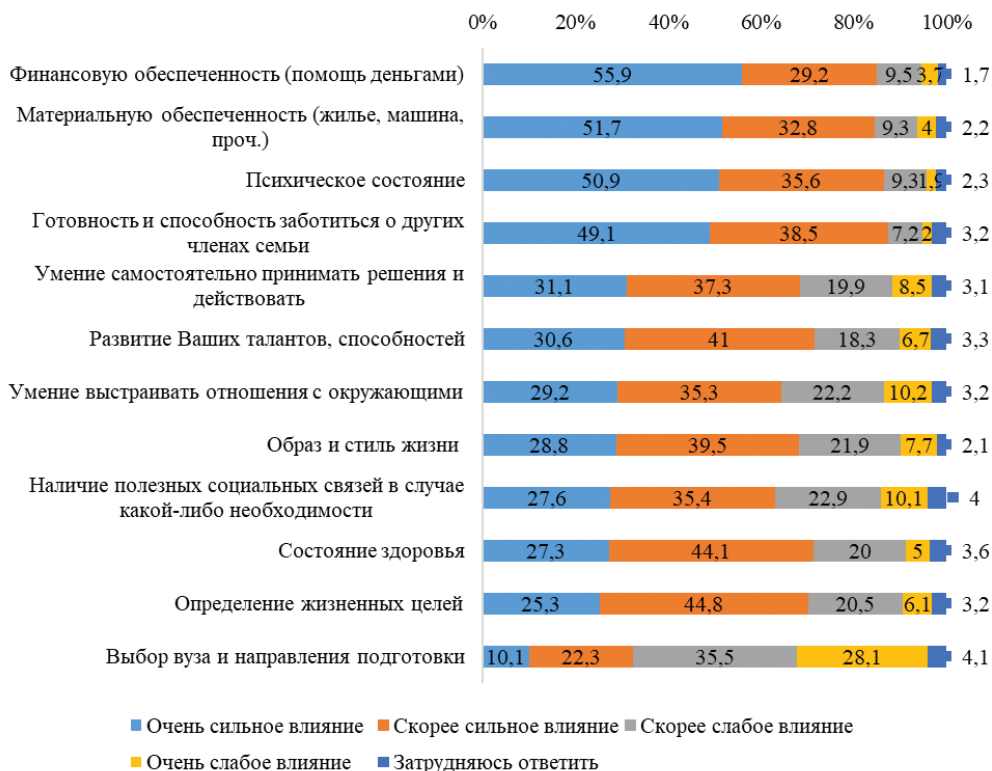
Рис. 1. Представления респондентов о влиянии семьи на разные аспекты их жизни, %

Опрошенные отмечают сильное влияние семьи на разные аспекты их жизни, что можно рассмотреть в ракурсе функциональных ценностей семьи [14]. Подавляющее большинство респондентов указывает на воздействие (очень сильное и скорее сильное) семьи на их компетенции и ориентации на выполнение социальных ролей в семье («готовность и способность заботиться о других членах семьи» — 88 %), психическое состояние (87 %), финансовую (85 %) и материальную обеспеченность (85 %) (рис. 1). Студенты магистратуры несколько реже фиксируют сильное влияние семьи на их финансовое (78 %) и материальное (80 %) благополучие, чем обучающиеся бакалавриата (87 и 85 % соответственно) и специалитета (89 и 91 %), видимо, потому что магистранты уже обрели самостоятельность в этом вопросе.