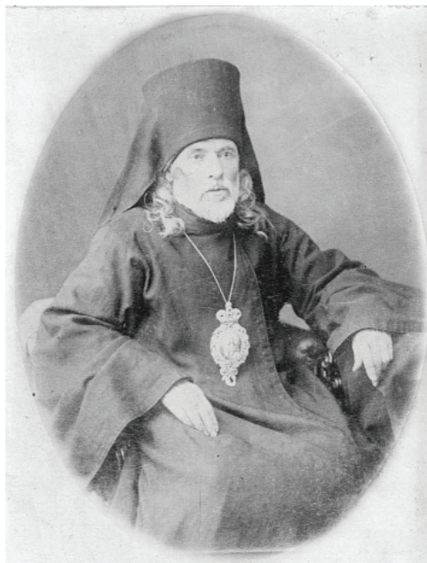
Епископ Якутский и Вилюйский Иаков (Домский). 1880-е гг. Bishop Iakov (Domskey) of Yakutsk and Vilyuisk. 1880s

Северо-Восточной Сибири, родился 6/28 июля 1823 г. в семье священника Петра, «поименованного по местности Домским» 22 . Его отец был настоятелем небольшого храма во имя Иоанна Богослова в с. Семенки Брацлавского уезда Подольской губернии 23 .