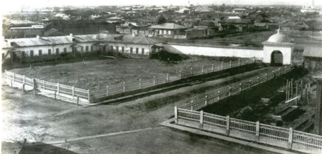
Якутск. Кельи и двор Спасского монастыря. Начало XX в. Yakutsk. The cells and courtyard of the Spassky Monastery. Early XX century