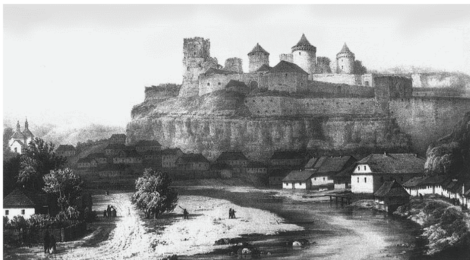
Вид города Каменец-Подольский. 1860-е гг. Рисунок Н. Орды View of the town of Kamenez-Podolsky. 1860s. Picture of N. Orda