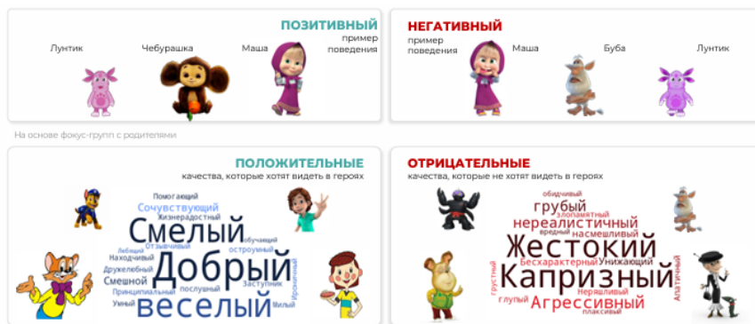
Ил.4. Личностные качества положительных и отрицательных персонажей популярных мультфильмов по результатам опроса родителей детей от двух до восьми лет (N = 1200).

шего дошкольного возраста по причине формирования системы нравственных координат личности. Представитель добра – главный герой, характеризующийся совокупностью положительных личностных качеств. Представитель зла – злодей с противоположным личностным профилем. По мере взросления ребёнка абсолютность категорий добра и зла размывается, возникают допуски относительности, ребёнку становятся понятны феномены «ложь во спасение» и др. Положительный герой может позволять себе слабости, быть неидеальным, а злодей – привлекать своим внешним обликом, лидерскими качествами безотносительно нравственной оценки направленности его действий. Значимый персонаж перестаёт быть «плоским», обретает сложность и дифференцированность, оценка его действий со стороны ребёнка перестаёт быть однозначной, обретает ситуативность, появляется амбивалентное отношение к нему в зависимости от поступков персонажа и их обоснования (ил. 4).