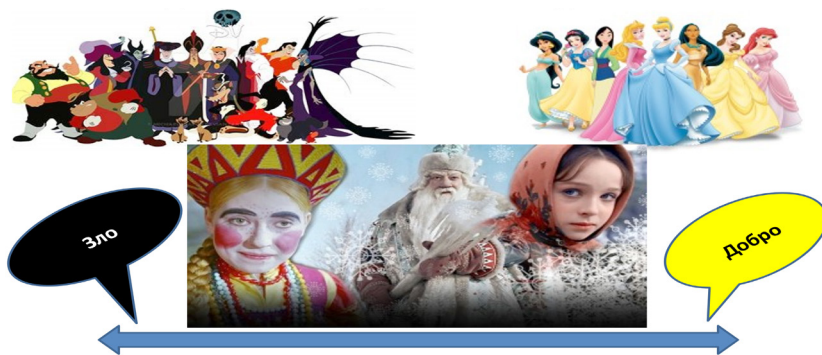
Ил. 3. Формирование и категоризация представлений о добре и зле в дошкольном детстве

ющиеся от норм и установок, декларируемых гуманистической парадигмой. В этом случае исход дихотомии добра и зла, света и тьмы, правды и лжи в картине мира ребёнка объективно определяется ведущим объектом идентификации (ил. 3).