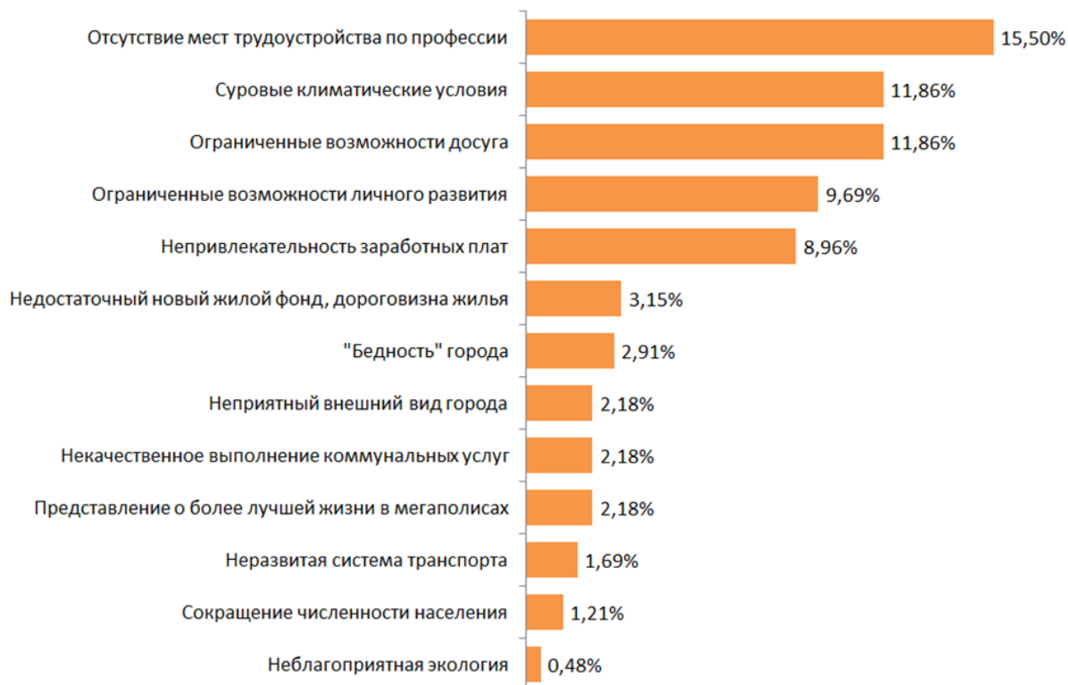
Рисунок 4. Характеристики арктических городов, способствующие формированию установок на миграцию в другие города

существенного снижается за последние годы – озвучивается молодежью и является причиной, по которой, по мнению молодежи, более массово формируются установки населения на миграцию из арктического города (например, из -за «превращения Мурманска в «вахтовый» город»). На рисунке 4 более подробно раскрыты характеристики и особенности городов, способствующие желанию мигрировать в другие города, ранжированные по доле упоминаний (за исключением 26% упоминаний, связанных с личными и семейными обстоятельствами).