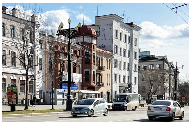
Рис. 6. Здание дома аптекаря В. Ф. Зандау. Современное состояние.

К рациональной линии модерна, характеризующейся работой с крупными объемами и выявлением во внешних формах конструктивных и функциональных особенностей сооружения, относится здание дома аптекаря В. Ф. Зандау (рис. 6). Авторство объекта и дата его строительства спорны. По одним данным оно построено в 1913 г. предположительно по проекту академика А. И. фон Гогена [9] . В пользу этой версии говорит сильное внешнее сходство объекта с особняком М. Ф. Кшесинской, построенным архитектором в Петербурге в 1904–1906 гг. Сам проект и фотографии его реализации были опубликованы на страницах журнала «Зодчий». Другие источники датируют объект 1906 г. без указания авторства [8] . Тем не менее благодаря своему сложному разноэтажному силуэту и трехгранному эркеру с куполом, акцентирующему центральный вход, сооружение доминировало в структуре окружающей застройки. В 1930-е гг. к его юго-западному фасаду была пристроена пятиэтажная гостиница, вследствие чего здание дома аптекаря В. Ф. Зандау утратило доминирующую роль в структуре квартала.