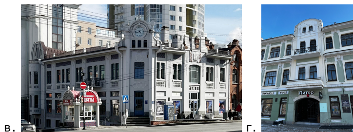
Рис. 5. Стиль модерн в застройки ул. Муравьева-Амурского.

а) Здание доходного дома Хлебникова после реконструкции 1912–1913 гг.; б) Здание гостиницы «Эспланад», 1913 г.;