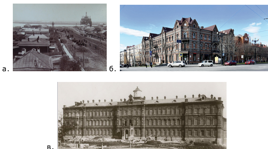
Рис. 1. Образцы архитектуры русского стиля в Хабаровске. а) Панорама улицы Муравьева-Амурского с Успенским собором ( https://todaykhv.ru/news/culture/33035/ ); б) Здание Доходного дома Плюсниных, 1902 г. Арх. Ю. З. Колмачевский. Фото М. Е. Базилевича; в) Здание Ремесленного училища, 1900–1903 гг. ( https://natpopova.livejournal.com/372472.html )

Еще один образец архитектуры русского стиля представляет здание доходного дома купцов Плюсниных, построенное в 1900 г. по соседству с Успенским собором и начинающее сплошной фронт застройки по нечетной стороне ул. Муравьева-Амурского (рис. 1а). В том же году на северной стороне Николаевской площади началось строительство Ремесленного училища, зафиксировавшего центральную композиционную ось улицы Муравьева-Амурского (рис. 1в). Сооружение возведено в формах эклектики, однако, мотивы русского стиля проявляются в рисунке элементов его фасадного декора.