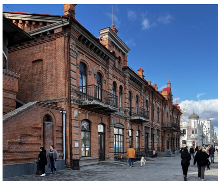
Рис. 4. Застройка нечетной стороны ул. Муравьева-Амурского. Слева направо: доходные дома Тарцевых (1908 г.); Пьянковых (1900 г.); И. Такеучи (1912 г.).