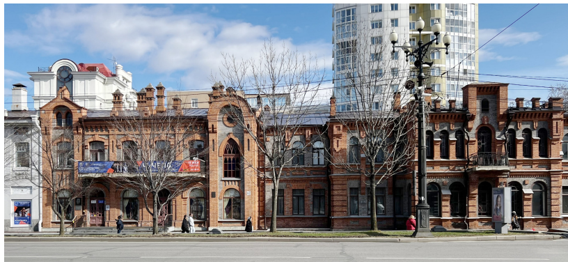
Рис. 3. Застройка четной стороны ул. Муравьева-Амурского. Слева Доходный дом Н. Р. Кровякова, справа здание Общественного собрания, 1901 г. Арх. В. А. Рассушин.