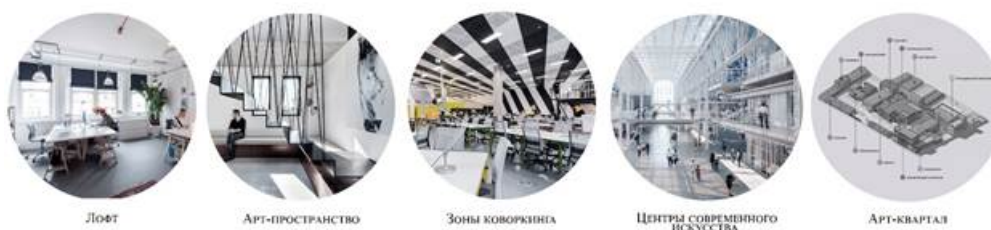
Рис. 1 Классификация креативных пространств по типу помещений

(Fig. 1. Classification of creative spaces by type of premises)