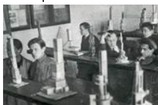
Рис. 2.1 Высшие художественно-технические мастерские, 1920-е гг.