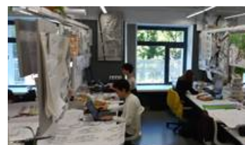
Рис. 2.3 Казанский государственный архитектурно-строительный университет, 2022 г.

Личный архив авторов (Fig. 2.3. Kazan State University of Architecture and Civil Engineering, 2022 Personal author's archive)