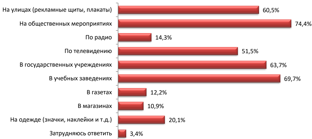
Рис. 2. Распределение ответов на вопрос «Где Вы в родном городе/поселке видите флаг, герб и слышите гимн страны, которой являетесь гражданином? (Отметьте все, что Вам подходит)» (% , n = 468)

На вопрос «Где Вы в родном городе/поселке видите флаг, герб и слышите гимн страны, которой являетесь гражданином?» большинство опрошенных указали «на общественных мероприятиях» и «в учебных заведениях» (74,4 и 69,7 % соответственно), а также в государственных учреждениях и на улицах (63,7 и 60,5 % соответственно). И лишь 3,4 % респондентов затруднились ответить (рис. 2).