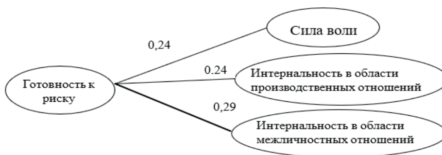
Рис. 2. Взаимосвязи показателя «готовности к риску», силы воли и локус контроля курсантов военной академии

при выполнении учебных и служебно-боевых задач. Это может означать, что курсанты, склонные принимать риски, имеют тенденцию чувствовать большую ответственность за результаты своей деятельности и уверенность в том, что могут влиять на окружающие обстоятельства в военной среде.