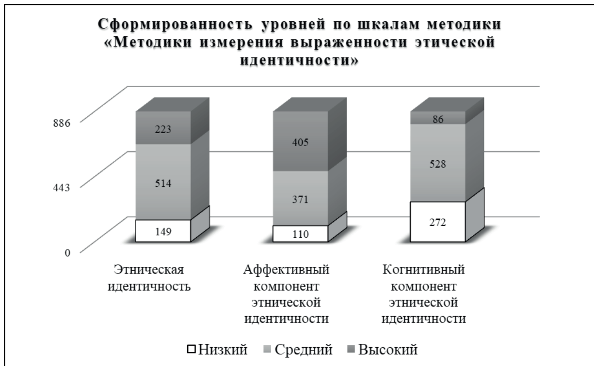
Рис. 1. Сформированность уровней по шкалам «Методики измерения выраженности этической идентичности»

Высокие показатели по аффективному компоненту отражают важность эмоциональной связи с этнической группой. Для молодежи характерно стремление к принадлежности, в том числе это реализуется через эмоциональное принятие своих этнических корней. Но средний уровень сформированности когнитивного компонента указывает на некоторый недостаток систематических