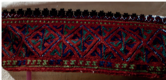
Рис. 2. Нагрудная вышивка женской рубахи царевококшайских мари. Из коллекции Старокрещенского Дома ремесел Оршанского района Республики Марий Эл