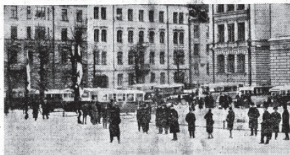
Omnibus- ja kuorma-autonäyttely ruotsalaisen neuvomaalilaitoksen pihoilla

Tilaisuudessa läsnä m. m. tasavallan presidentti hallituksen jäseniä ja ulkovaltain edustajia.