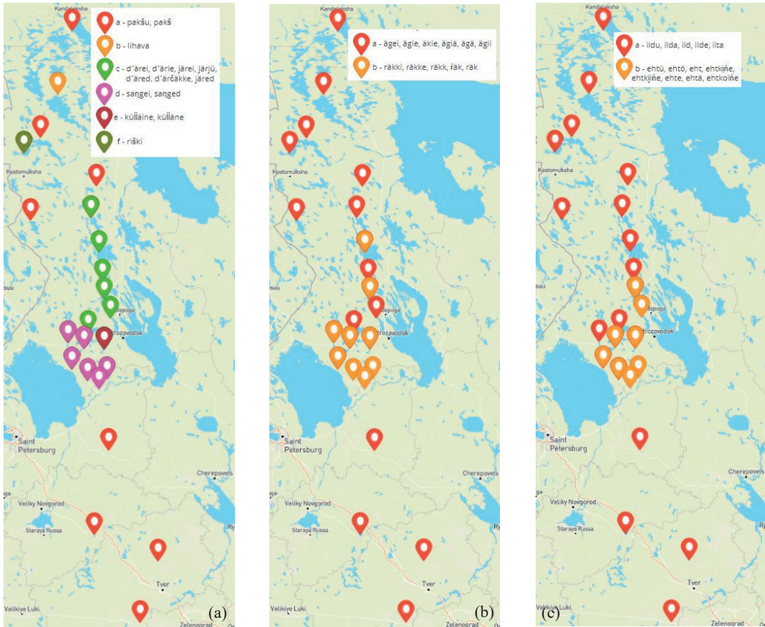
Рис. 2. Распределение лексем, обозначающих понятия «толстый» (а), «жар» (б), «вечер» (с) в диалектах карельского языка