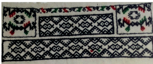
Рис. 1. Вышивка головного убора сорока . Из коллекции Национального музея Республики Марий Эл им. Т. Евсеева

Обучение девочки искусству вышивания у мари начиналось непосредственно с украшения вещи, которая обладала глубоким символическим значением и фактически представляла собой изобразительную версию мифологической вселенной, – свадебной рубахи [13, 139]. Устная традиция сохранила представление об охранительном значении нагрудного орнамента « чызе орол » («сторож грудей») женских рубах [10, 21–22]. Использование образа водоплавающей птицы в нагрудной вышивке у царевококшайских мари указывало на ее небесную символику [4, 21–22].