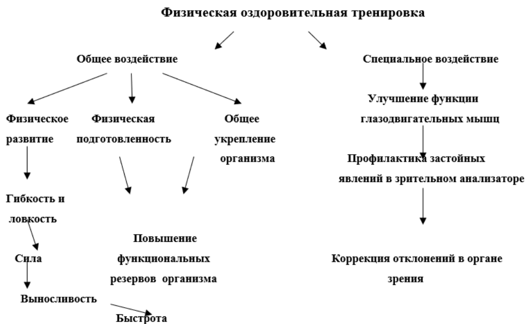
Рис. 1. Структура и направленность физической тренировки