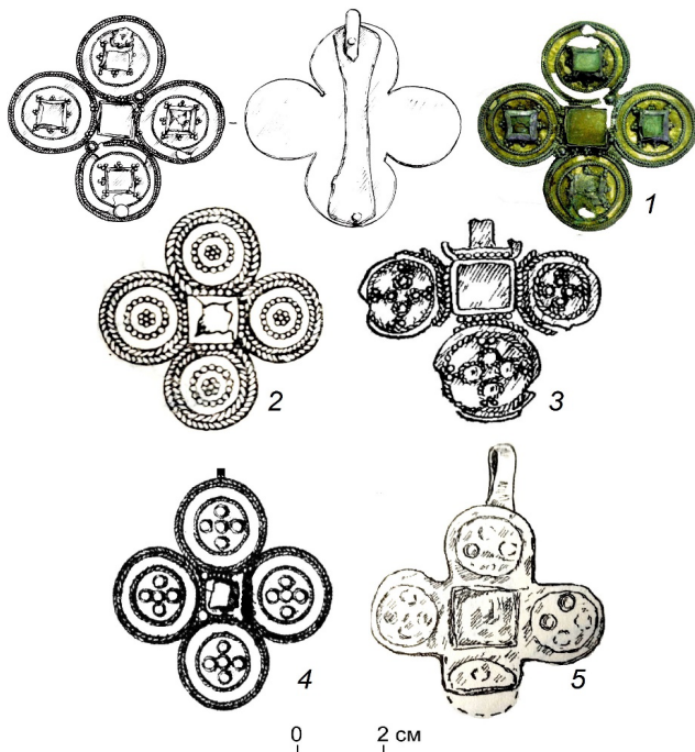
Рисунок 3. Зерно-филигранные крестовидные подвески. Аналогии. Прорисовки: И.Ю. Пастушенко, Э.А. Савельева, Г.А. Архипов, Ю.А. Подосенова, А.Г. Иванов. 1 – Кишертский могильник; 2 – Кокпомьягский могильник; 3 – Починковский могильник; 4 – Новгород; 5 – Печешурский могильник.

Figure 3. Grain-filigree cross-shaped pendants. Analogies. Trace drawings: I.Yu. Pastushenko, E.A. Savelyeva, G.A. Arkhipov, Yu.A. Podosenova, A.G. Ivanov. 1 – the Kishert burial ground, 2 – the Kokpomiyag burial ground; 3 – the Pochinkovo burial ground; 4 – Novgorod, 5 – the Pecheshur burial ground.