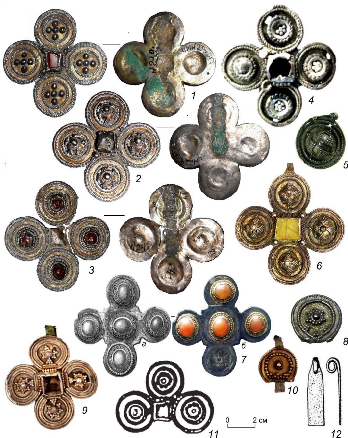
Рисунок 1. Зерно-филигранные крестовидные подвески. Фото: К.А. Руденко, из архива Ю.А. Подосеновой. Прорисовки: Р.Д. Голдина, Т.К. Ютина, М.В. Талицкий. Родановская культура. 1-3, 12 – Вильгортский клад (Чердынский краеведческий музей им. А.С. Пушкина); 4 – музей археологии Европейского Северо-Востока Коми НЦ УрО РАН; 5 – дер. Данилова (коллекция Теплоуховых, Пермский краевой музей); 6, 9, 10 – Пермский край, сборы; 7 – Верхне-Березовский починок, коллекция Теплоуховых (Пермский краевой музей); 8 – дер. Елева (коллекция Теплоуховых, Пермский краевой музей); 11 – Агафоновский II могильник.

Figure 1. Grain-filigree cross-shaped pendants. Photos: K.A. Rudenko, from the archives of Yu.A. Podosenova. Trace drawings: R.D. Goldina, T.K. Yutina, M.V. Talitsky. The Rodanovo archeological culture. 1-3, 12 – the Vilgort treasure (the Cherdyn Museum of Local Lore named after A.S. Pushkin); 4 – the Museum of Archaeology of the European North-East of the Komi Science Centre of the Ural Branch of the Russian Academy of Sciences; 5 – the Danilova village (the Teploukhovs collection, the Perm Regional Museum); 6, 9, 10 – the Perm region, collections; 7 – the Verkhne-Berezovsky settlement, the Teploukhovs collection (the Perm Regional Museum); 8 – the Eleva village (the Teploukhovs collection, the Perm Regional Museum); 11 – the Agafonovo II Burial Ground.