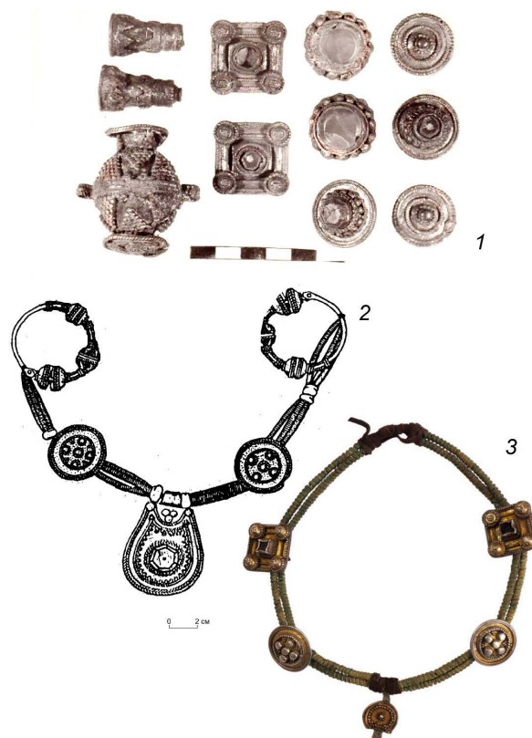
Рисунок 4. Вильгортский клад и женские наборные украшения с зерно-филигранными изделиями. 1 – Вильгортский клад; 2 – Ыджыдьельский могильник, очелье (по Э.А. Савельевой); 3 – Пермский край, шейно-нагрудное украшение.

Погребения, при разборе которых были обнаружены изделия, в основном принадлежали женщинам (погр. 7 Починковского, погр. 310 Агафоновского II, погр. 21 Кишертского могильников). Судя по конструкции петли на изнаночной стороне и остаткам кожаного ремешка в петле, украшения из Починковского могильника [11, с. 39], а также судя по залеганию их в районе груди (например, изделия из Починковского, Агафоновского II могильников), изделия возможно отнести к категории женских шейно-нагрудных украшений. Возможно, изделия являлись частью целых ожерелий, составленных по определенному образцу: на тоненький шнурок, проходящий через спиральновитую пронизку, подвешивали основное украшение (в данном случае зерно-филигранную крестовидную подвеску), а по бокам на одинаковом расстоянии друг от друга – дополнительные металлические украшения, выполненные в аналогичном стиле. Собранные по такому образцу ожерелья происходят из частных коллекций с территории Пермского края, где от зерно-филигранной крестовидной подвески сохранилась