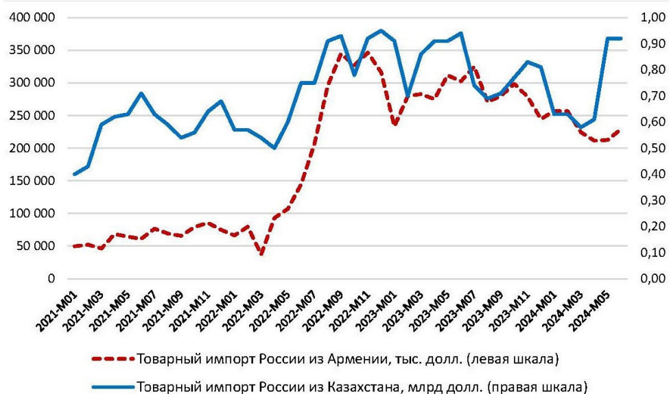
Рис. 1. Динамика российского импорта товаров из Армении и Казахстана в период с января 2021 г. по июнь 2024 г.