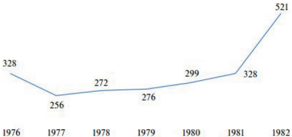
Рис. 2. КОЛИЧЕСТВО КРЕСТЬЯНСКИХ АКЦИЙ ПРОТЕСТА (1976—1982 гг.)