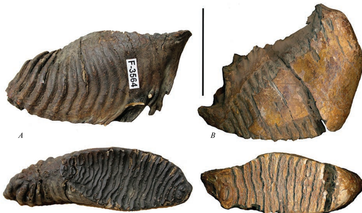
Рис. 2. Мелкие зубы последней смены шерстистого мамонта M. primigenius : А – m3, колл. номер F-3564, Индиги́ро-Колы́мская низменность; В – М3 с колл. номером PP-1, Московский регион. Вид сбоку и с жевательной поверхности. Масштаб 10 см.

Изученные мелкие зубы алазейских мамонтов с сокращенным КЗП имеют запредельный ^{14}\text{C} возраст (>45000 лет) (табл. 2, 3), по сохранности они сходны. Однако у крупных зубов из того же района сохранность иная, и два датированных образца имеют предельный возраст (табл. 3).