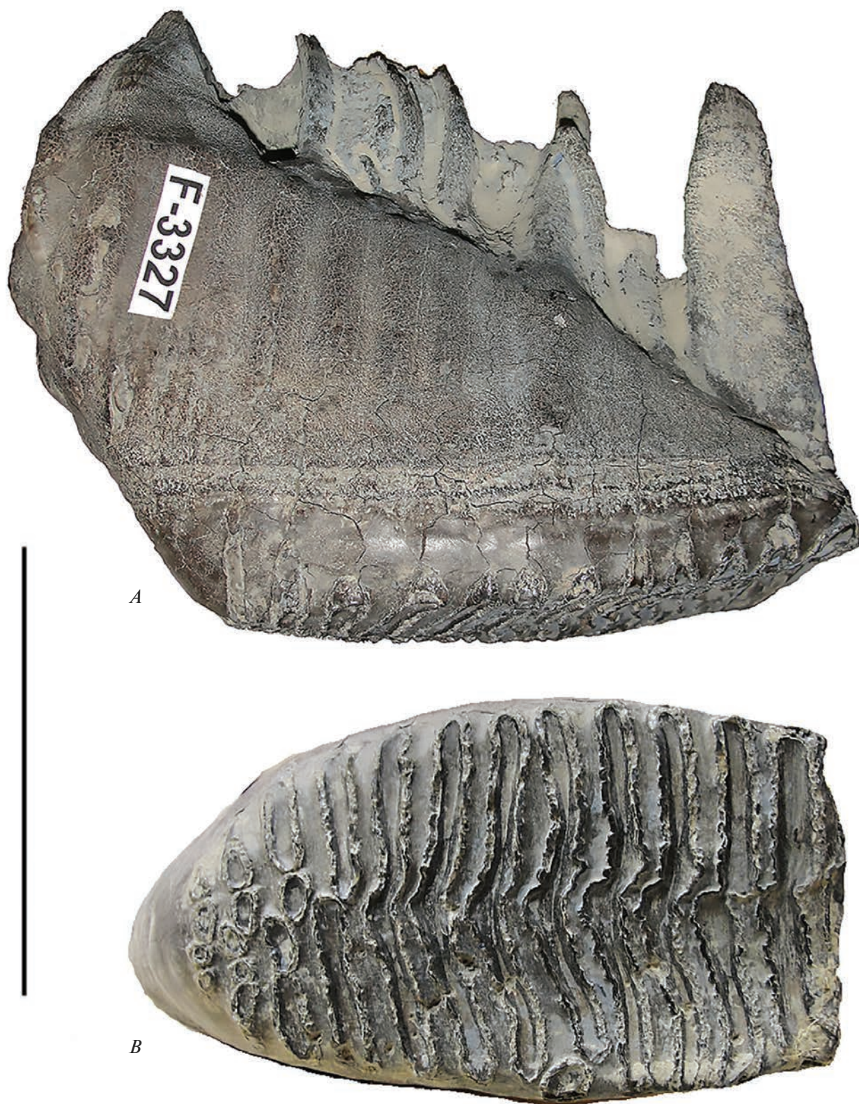
Рис. 1. М3 полукарликового M. primigenius № F-3327 с побережья Восточно-Сибирского моря. Вид: А – буккально, В – с жевательной поверхности. Масштаб 10 см.