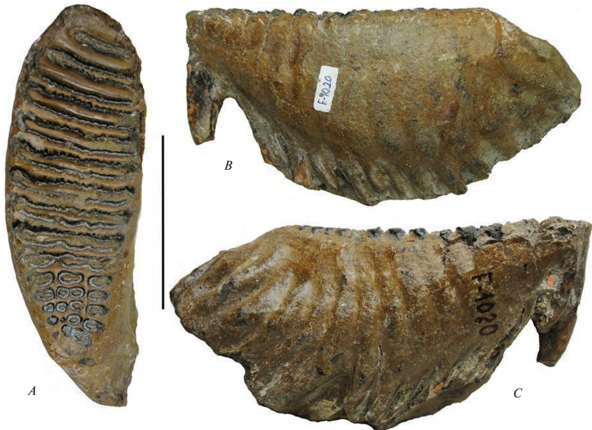
Рис. 3. Мелкий нижний правый зуб Mammuthus cf. intermedius , образец F-1020. Вид: А – с жевательной поверхности, В – лингвально, С – буккально. Масштаб 10 см.

бой цементом, отсутствующим у зачатка зуба в альвеоле; б) горизонтальной, в отличие от большинства млекопитающих, сменой зубов (рис. 4). По мере продвижения вперед и прорезывания цемент зуба консолидирует передние пластины, пока задние еще соединены мягкими тканями пульпы (Дуброво, 1960; Гарутт, 1977). Вследствие разных причин (например, воспалительных процессов, при уменьшении размеров челюстей или задержке смены) задняя часть зуба могла подвергаться модификациям: формированию загيبов, выходу отдельных и нескольких пластин из общего ряда и прикреплению в другом месте, что показано в предыдущей работе (Kirillova, 2009), и недоформированию задних пластин. При уменьшении размеров тела и соответствующим сокращением размеров альвеолы, челюсти и всего скелета, утрата части пластин зуба являлась эффективным способом его укорочения: зуб мог становиться меньше с потерей последних пластин. По мнению Листера, изменение КЗП не обязательно обусловлено изменениями размера моляров (Lister, Joysey, 1992), т.к. есть серии мелких зубов мамонта с “нормальным” КЗП, у кото-