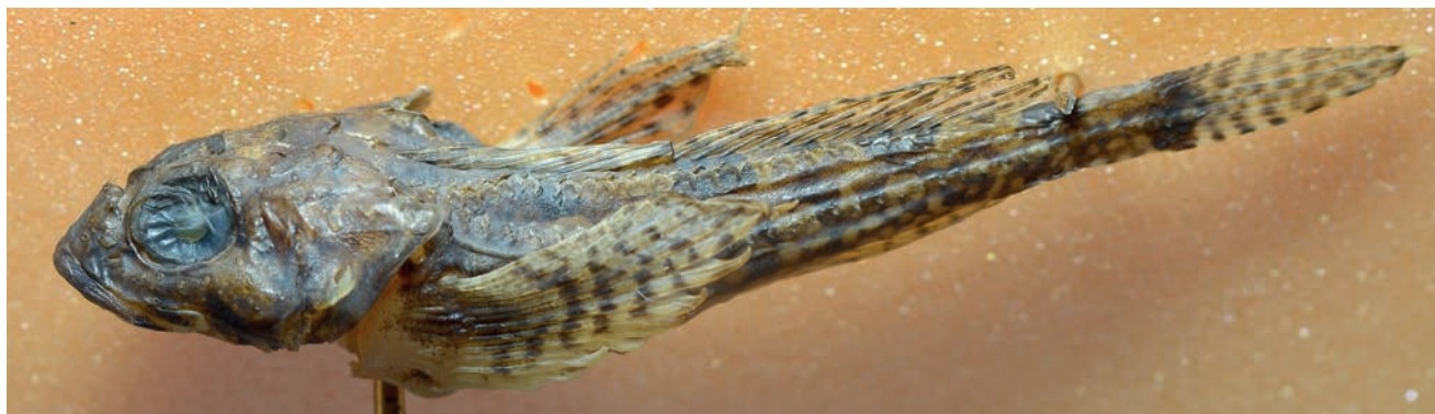
Рис. 2. Icelinus pietschi Yabe, Soma et Amaoka, 2001 – MIMB № 43170, TL 59 мм, SL 47 мм.

лучей, на нижней — четыре ветвистых и один неветвистый луч. Всего 11 лучей на гипуральных пластинках и 12 мелких нечленистых лучей.