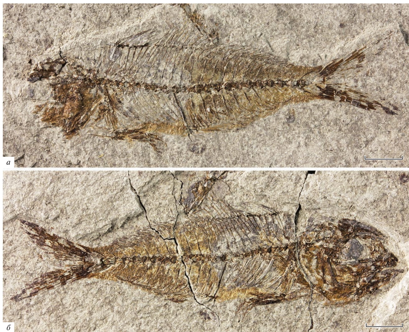
Рис. 1. Archaeus solus sp. nov., голотип ПИН, № 5419/15, полный скелет: a — общий вид, б — противоположный; Краснодарский край, Апшеронский р-н, р. Пшеха напротив хут. Горный Луч; нижний олигоцен, пшехская свита, планорбелловые слои. Масштабная линейка — 0.5 см.

короткий, но крепкий; retroarticulare не различимо. Ось hyomandibulare очень слабо наклонена вперед от вертикали. Метаптеригоид соединяет hyomandibulare с quadratum и ограничивает орбиту постеро-вентрально. Quadratum довольно широкое, округло-треугольное, с утолщенным постеро-вентральным краем и умеренным сочленовным мышелком. Ectopterygoideum образует передний стержень и расположенный под углом к нему постеро-вентральный отросток для сочленения с передним краем quadratum. Ectopterygoideum несет мелкие ямки на медиальной поверхности. Относительно крупное плоское entopterygoideum образует дно орбиты. Жаберная крышка умеренно широкая. Праорекулум относительно крупное, плоское, довольно слабо вогнуто вдоль утолщенного переднего края. Свободный край предкрышки ровный. Oreкулум довольно круп-