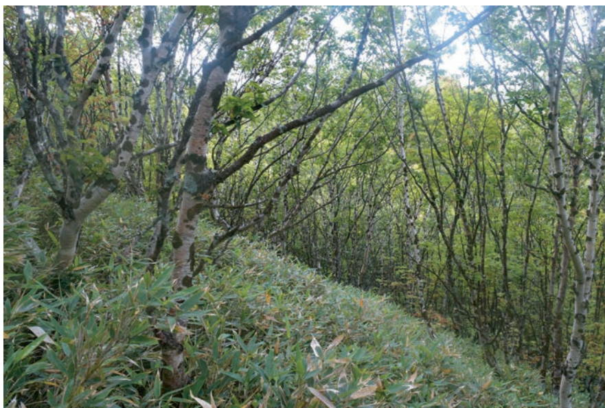
Рис. 2. Каменноберезняк бамбучниковый Saso-Betuletum ermanii . Fig. 2. Saso-Betuletum ermanii .