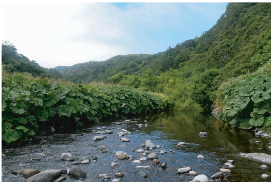
Рис. 4. Сообщество белокопытника Petasitetum japonici . Fig. 4. Petasitetum japonici .

tis-idaea , Parnassia palustris , Rhodiola rosea , Tilingia ajanensis , Arnica unalaschcensis , Hedysarum nonnae , Ophelia tetrapetala и др. Как правило, такие сообщества приурочены к нарушенным местообитаниям — они были встречены на старых дорогах и на заросшем аэродроме.