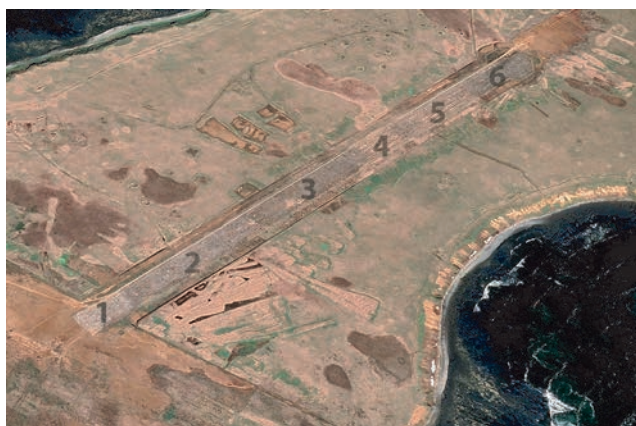
Рис. 5. Расположение сообществ на зарастающем аэродроме. Fig. 5. Location of communities on an overgrown airfield.

2. На увлажненном участке растения образуют полосы вдоль трещин. Такие участки осваивают преимущественно Hedysarum nonnae и Trisetum molle , вместе с ними встречаются Taraxacum ceratophorum , Anaphalis margaritacea , Deschampsia para-