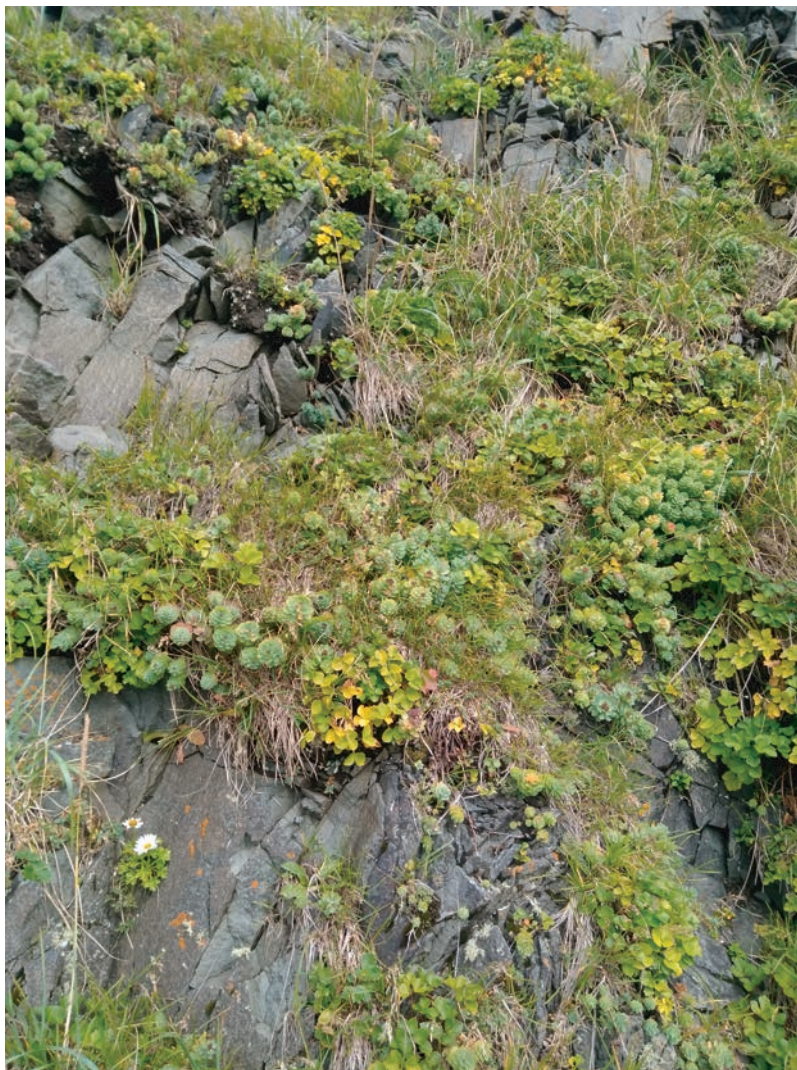
Рис. 1. Скальная растительность.