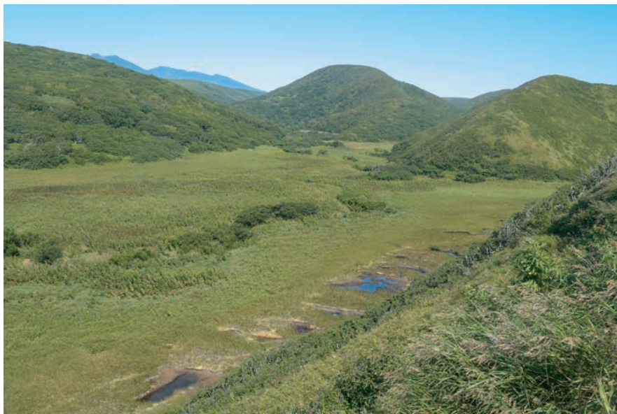
Рис. 7. Долина р. Кама в нижнем течении. Fig. 7. The valley of the Kama River in the lower reaches.

Для о. Уруп характерна речная сеть низкого порядка с грубым аллювием (Razjigaeva et al., 2022). Для верхних частей долин рек и ручьев характерны узкие крутосклонные русла с эрозионным врезом 30–40 м, в которых практически не происходит осадконакопления. На приустьевых участках преобладает аккумуляция как делювиальных и эоловых материалов, так и пирокластических, связанных с извержениями вулканов (Razjigaeva, Ganzey, 2006).