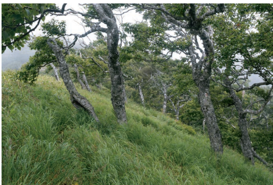
Рис. 3. Каменноберезняк вейниковый Calamagrostio-Betuletum ermanii . Fig. 3. Calamagrostio-Betuletum ermanii .

встречались более молодые 12–15 см. В остальных же случаях древостой выглядел более-менее одновозрастным.