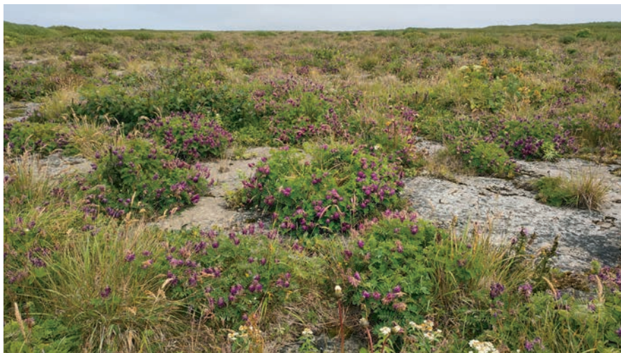
Рис. 6. Зарастающий аэродром.